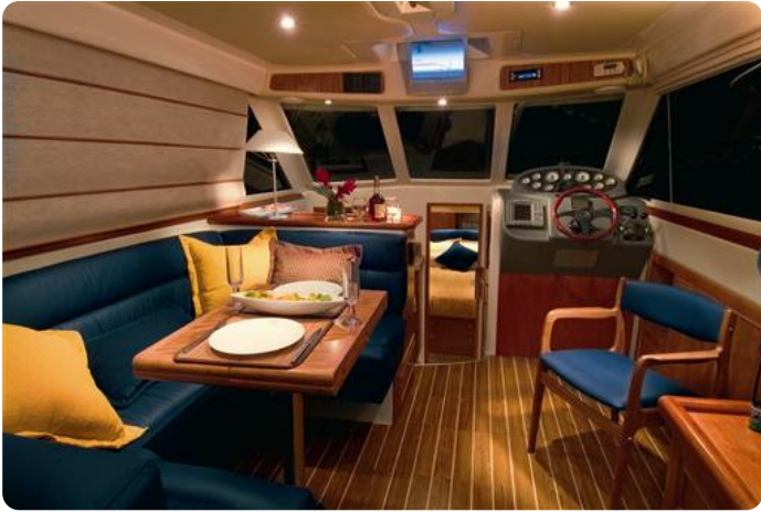
6Riviera 33 fly interior 1