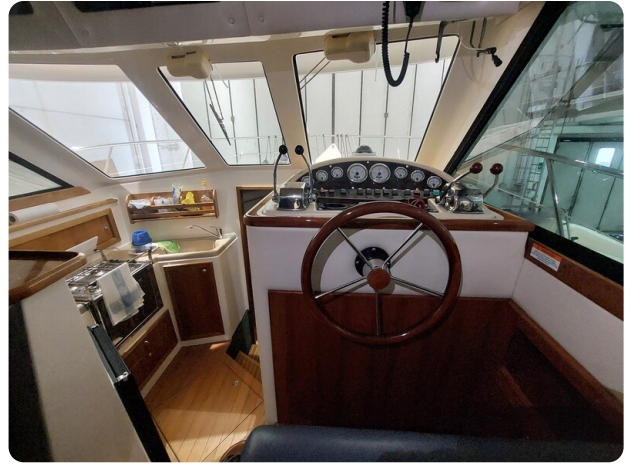
Riviera 33 fly 3