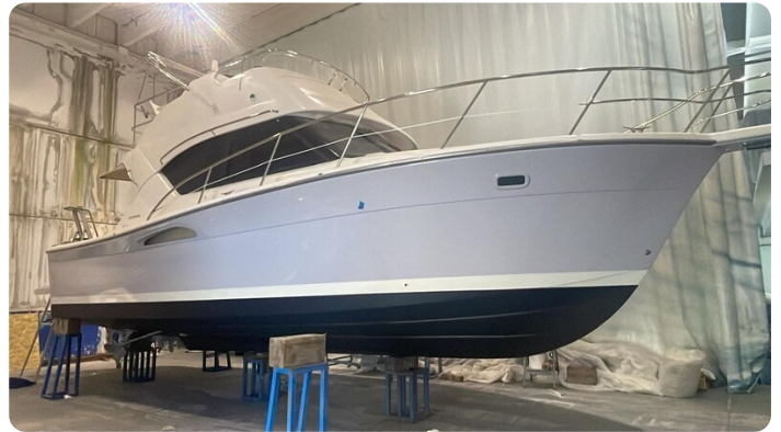
Riviera 33 fly hull 1