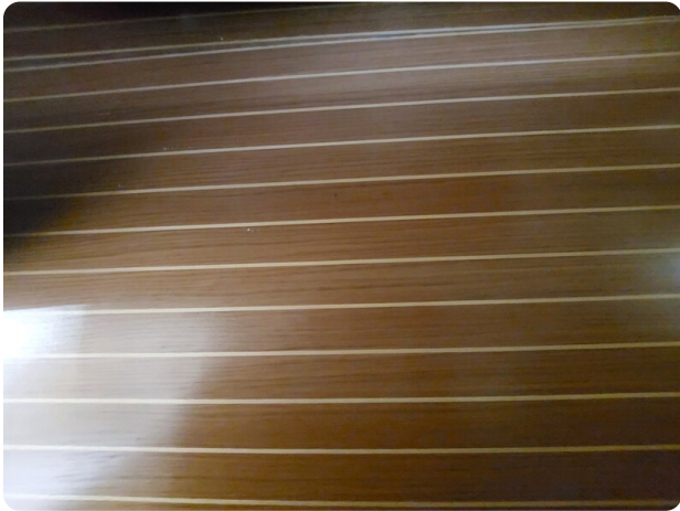
Riviera 33 fly 2