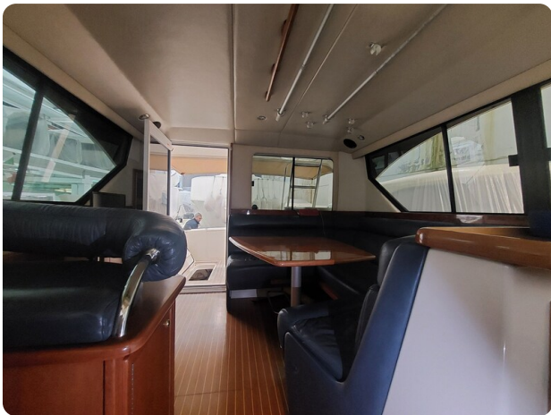
Riviera 33 fly 4