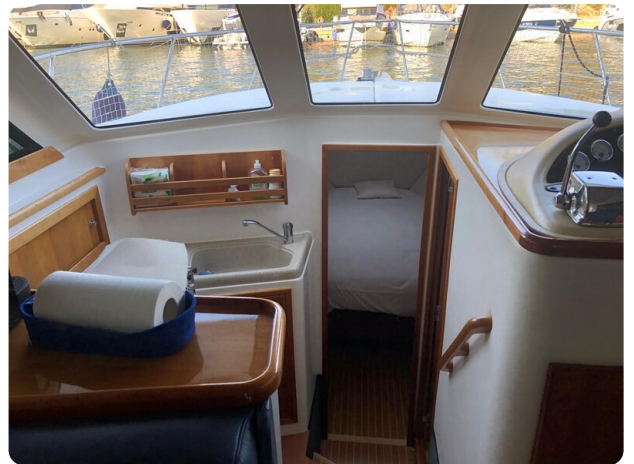
Riviera 33 fly cabin