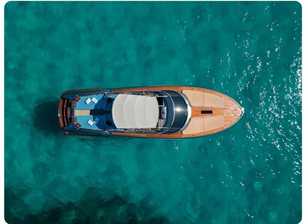
Rivarama Top View