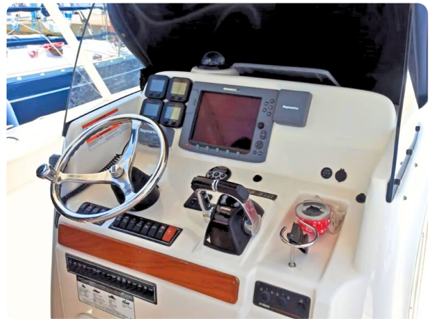
Pursuit 310 Sport Helm Station