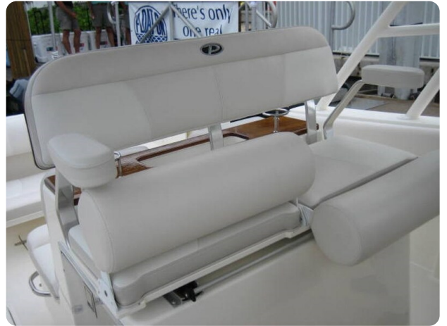
Pursuit S310 pilot seat