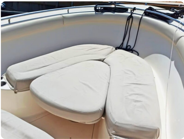
Pursuit 310 Sport Bow Sunpad