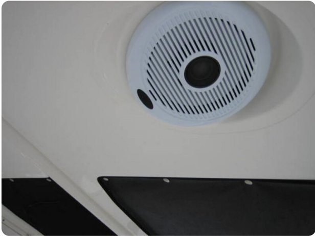
Pursuit S310 detail