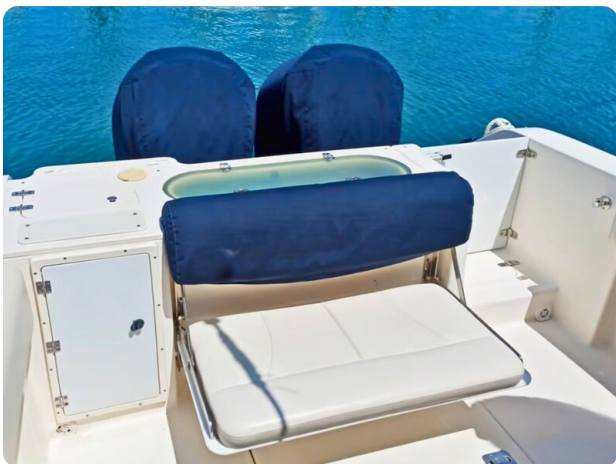
Pursuit 310 Sport Aft Seats