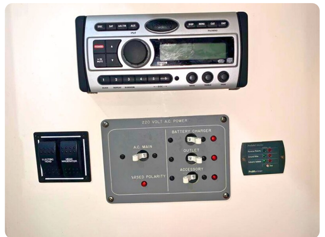
Pursuit 310 Sport Panel