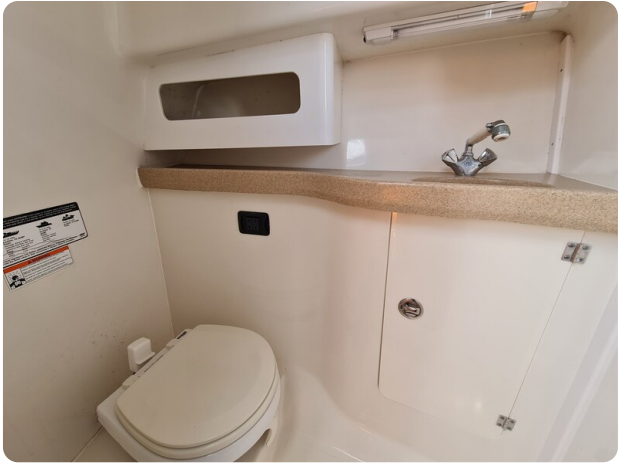
Proline 32 Express head view