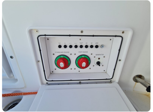
Proline 32 Express, cockpit detail