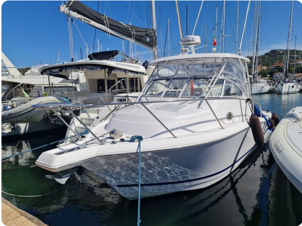
Proline 32 Express, bow view