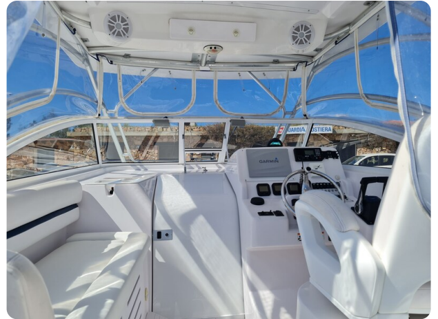
Proline 32 Express, upper cockpit