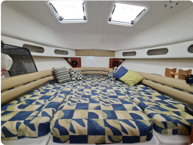
Proline 32 Express, berth