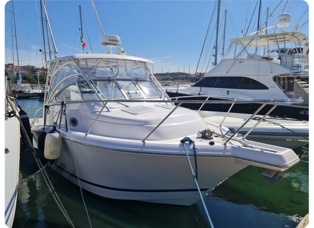
Proline 32 Express, bow profile