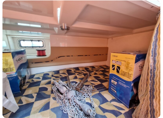
Proline 32 Express, aft cabin