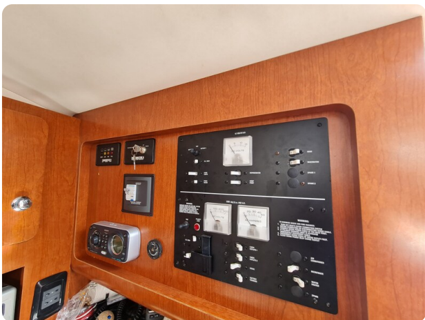
Proline 32 Express, electric panel