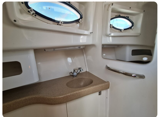
Proline 32 Express, bathroom