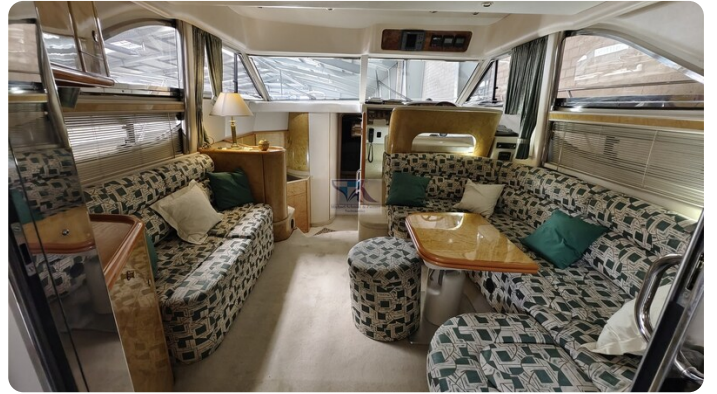
Princess 420 ARNO 1