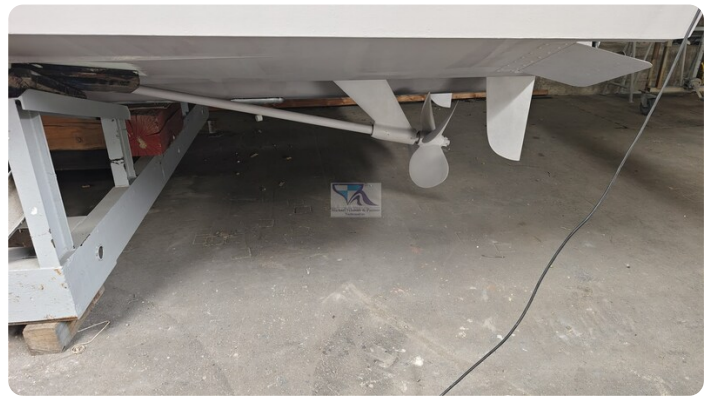
Princess 420 ARNO 34