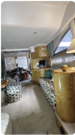
Princess 420 ARNO 13