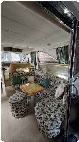
Princess 420 ARNO 3