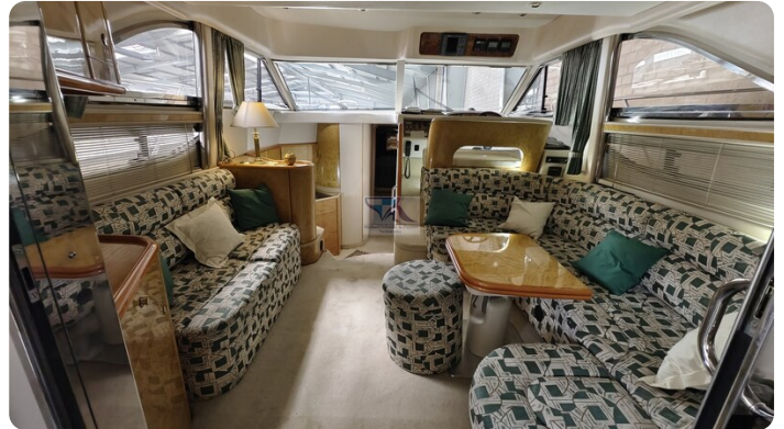
Princess 420 ARNO 1