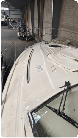
Princess 420 ARNO 47