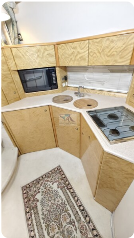
Princess 420 ARNO 25