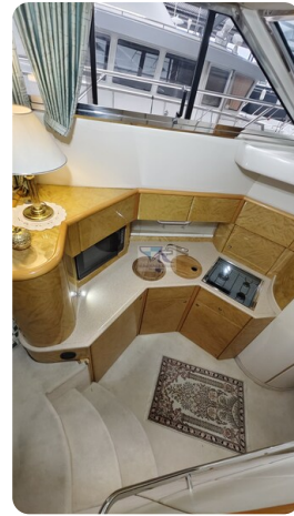
Princess 420 ARNO 11