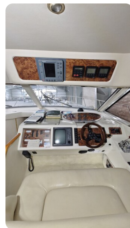
Princess 420 ARNO 6