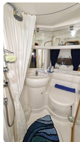
Princess 420 ARNO 20