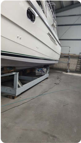
Princess 420 ARNO 33