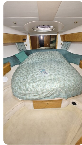
Princess 420 ARNO 15