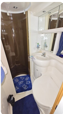
Princess 420 ARNO 18