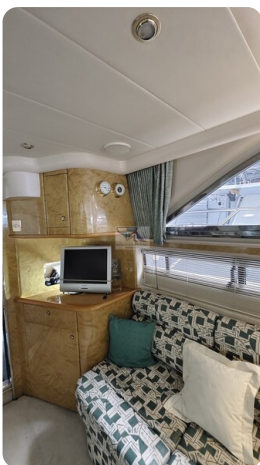
Princess 420 ARNO 5