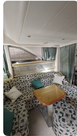
Princess 420 ARNO 4