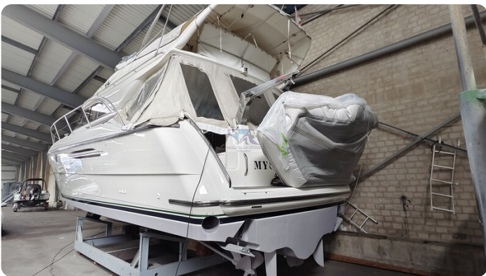
Princess 420 ARNO 35