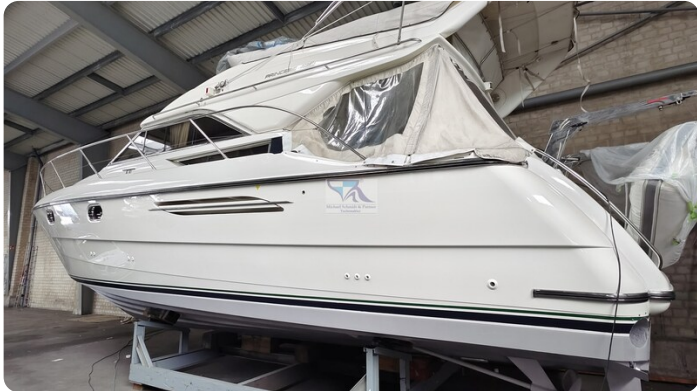
Princess 420 ARNO 37