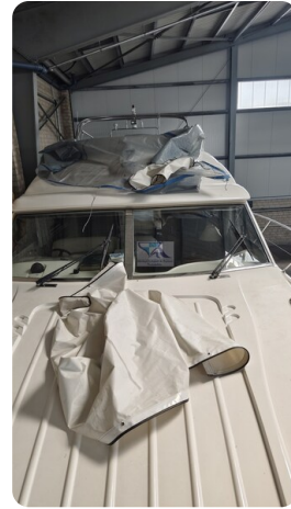
Princess 420 ARNO 49