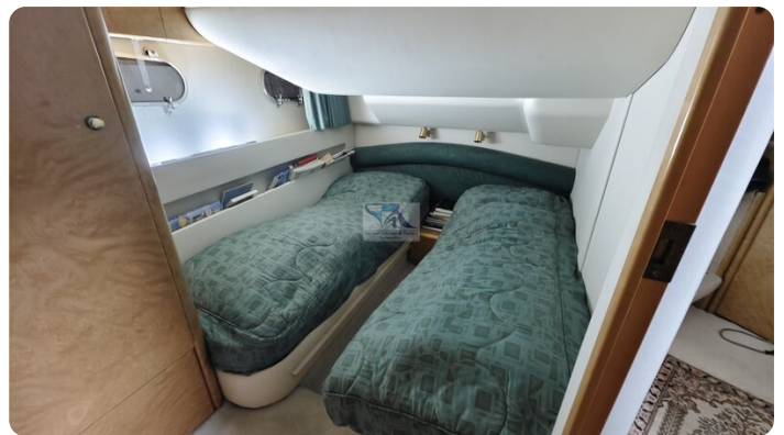
Princess 420 ARNO 45