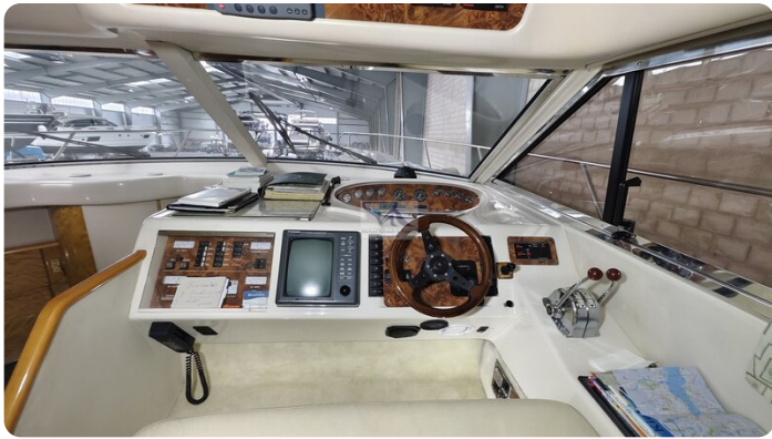
Princess 420 ARNO 8