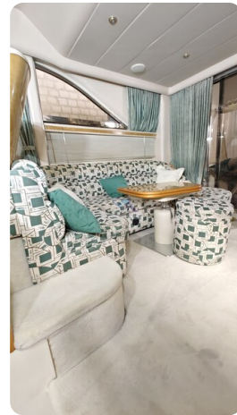
Princess 420 ARNO 28