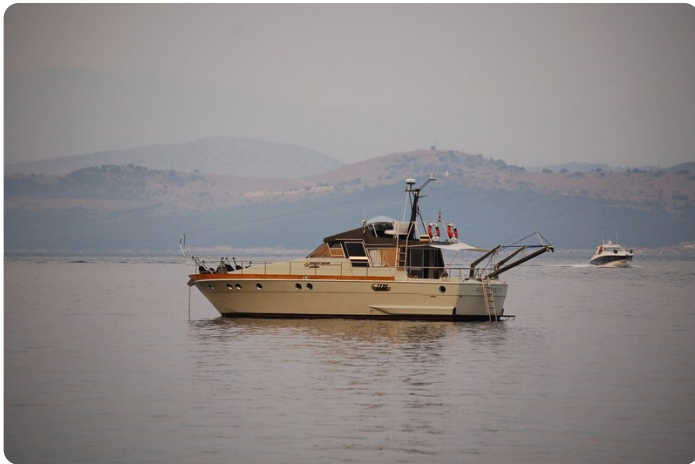
WN taverna nikolas corfu'1