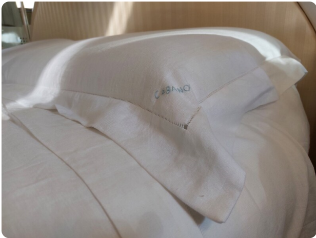
Picchiotti 68, Cabanon, corredo