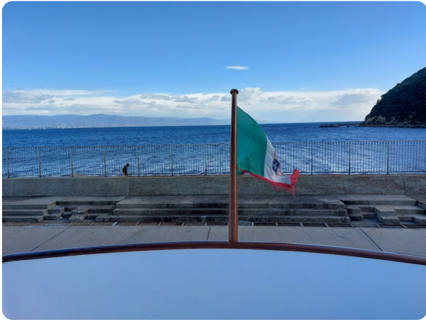
Picchiotti 68, Cabanon, flybridge det