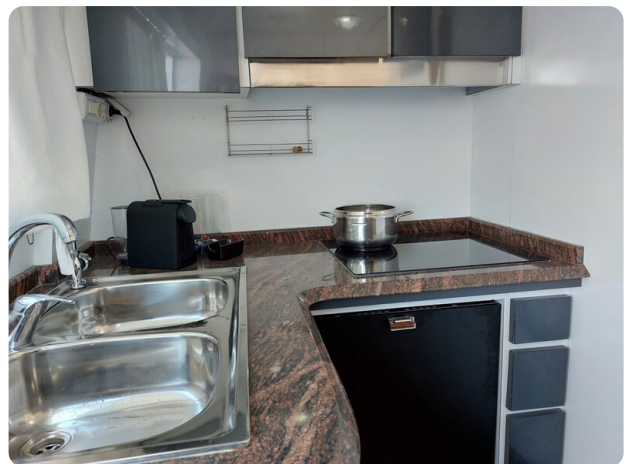
Picchiotti 68, Cabanon, cucina