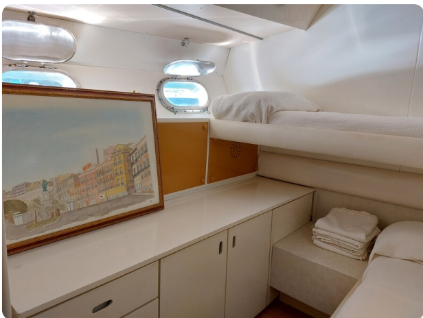
Picchiotti 68, Cabanon, cabina ospiti 3