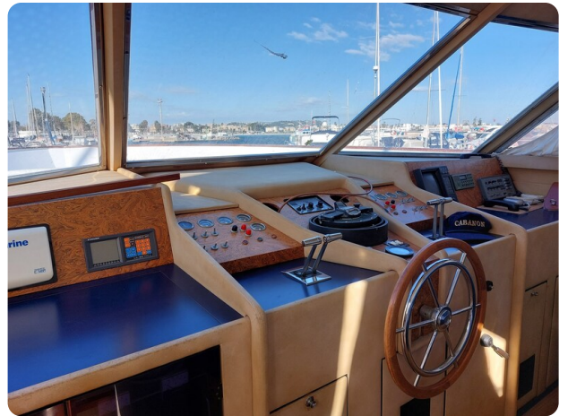
Picchiotti 68, Cabanon ponte di comando