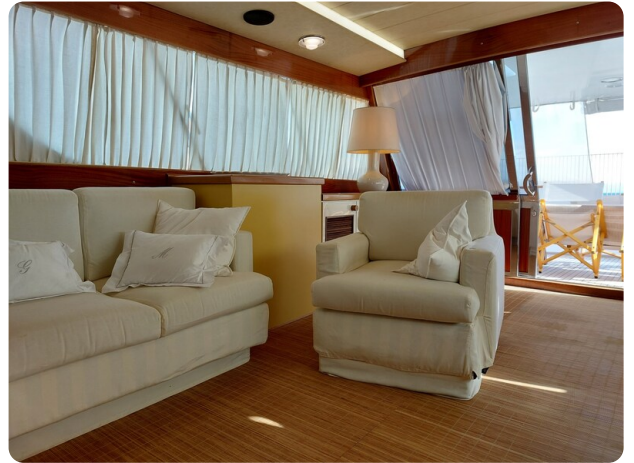
Picchiotti 68, Cabanon, salone 1