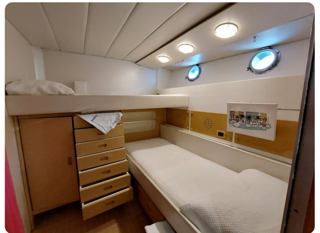
Picchiotti 68, Cabanon, cabina ospiti 2