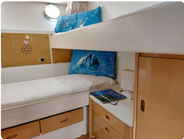
Picchiotti 68, Cabanon, cabina ospiti 1