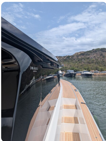
Pardo GT52 sideways