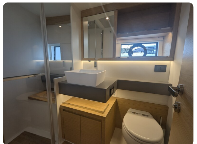
Pardo GT52 guest bathroom