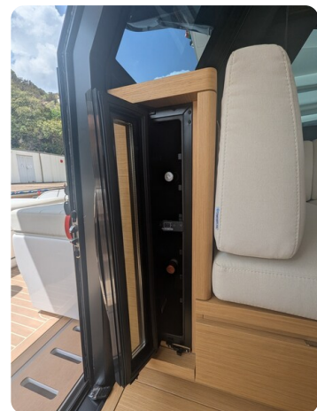
Pardo GT52 wine cooler