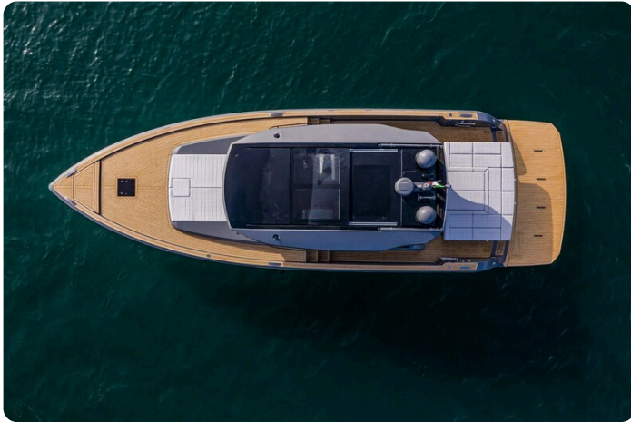
Pardo GT52 aerial view