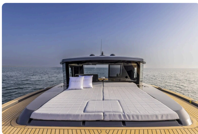
Pardo GT52 bow sunpad