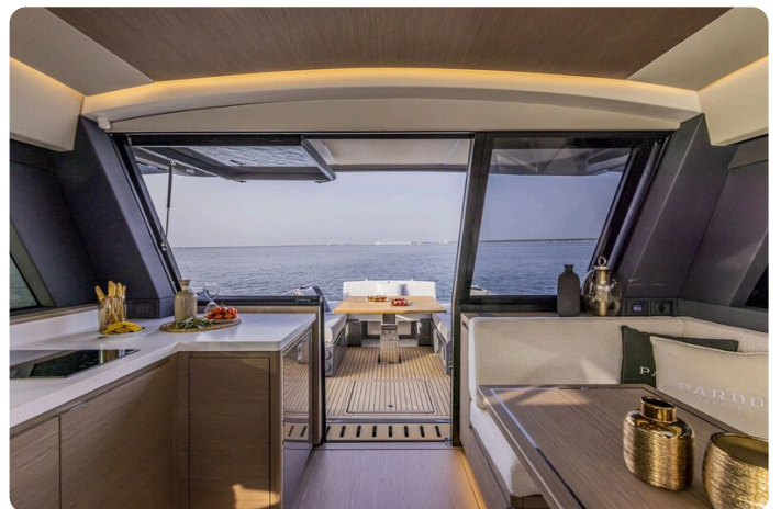
Pardo GT52 salon view to cockpit