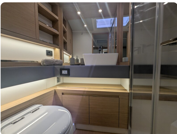
Pardo GT52 owner's bathroom