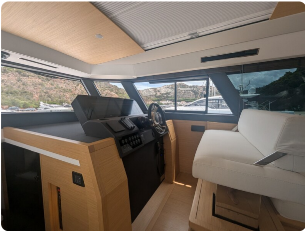
Pardo GT52 helm station