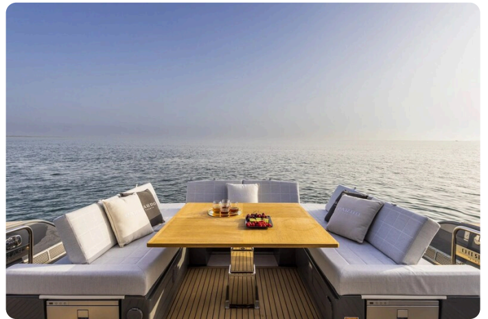
Pardo GT52 cockpit dinette