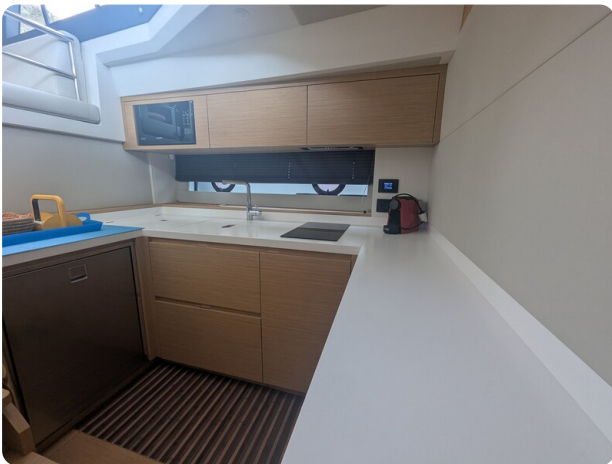
Pardo GT52 galley view