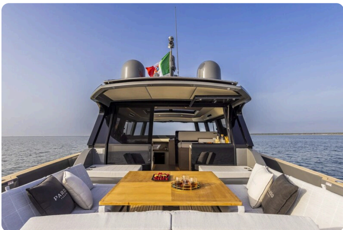
Pardo GT52 cockpit view