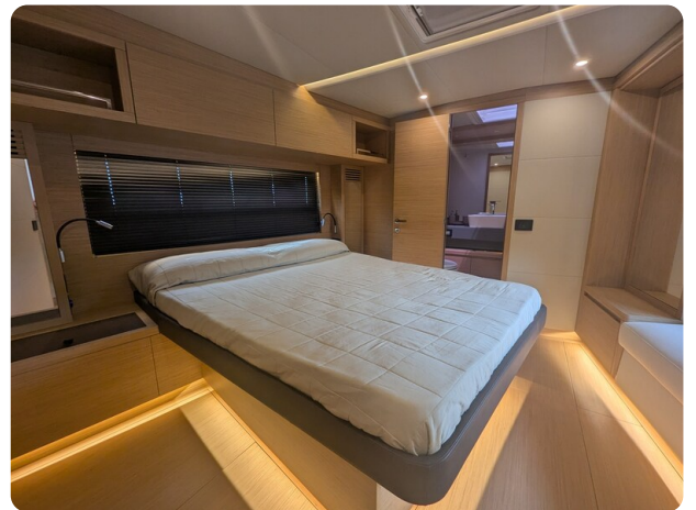
Pardo GT52 owner's cabin