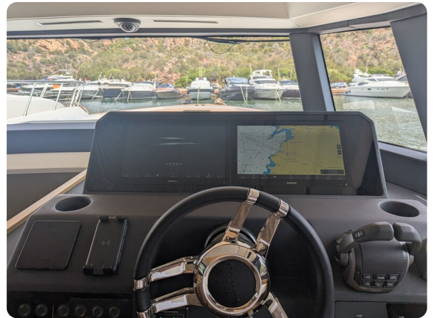
Pardo GT52 helm detail