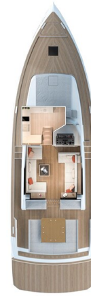
Pardo GT52 main deck