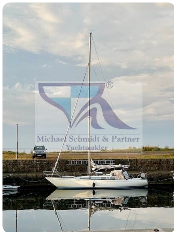
Avance 36 dL msp2