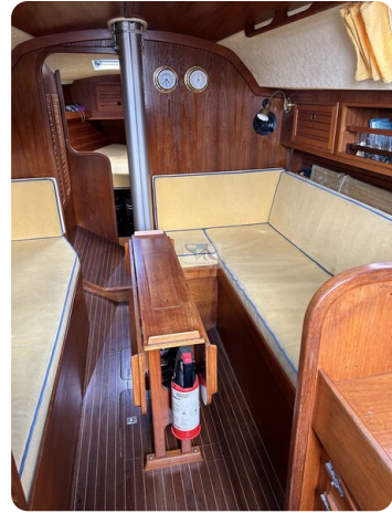
Avance 36 dL msp12