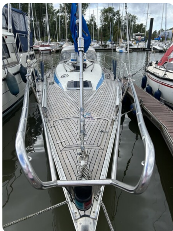
Avance 36 dL msp3