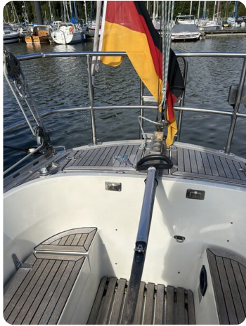
Avance 36 dL msp25