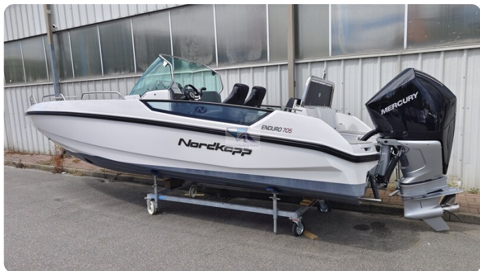
Nordkapp 705 50