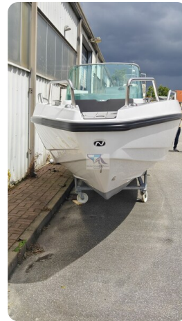
Nordkapp 705 54