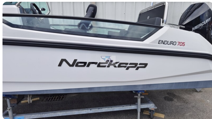
Nordkapp 705 51