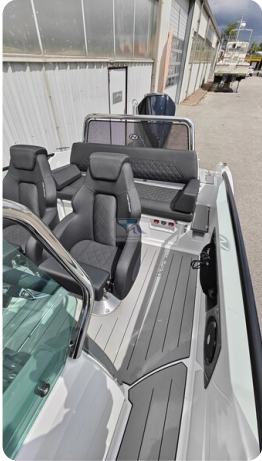
Nordkapp 705 29