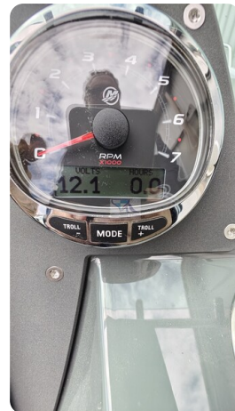
Nordkapp 705 41