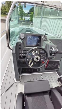
Nordkapp 705 36