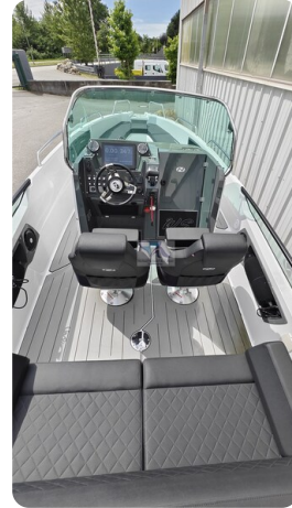
Nordkapp 705 33