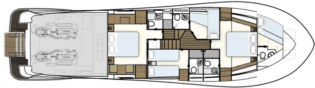
Lower deck, 4 cabin