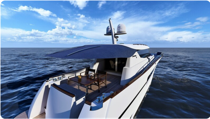
Copy of Stern