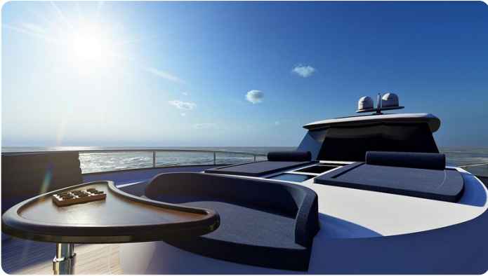
Copy of Bow