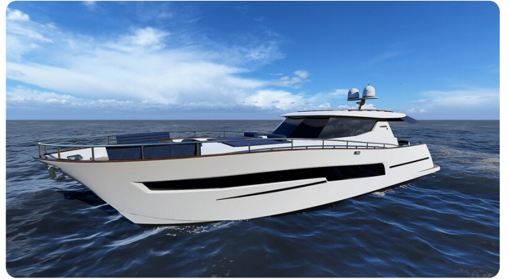
Copy of Front side