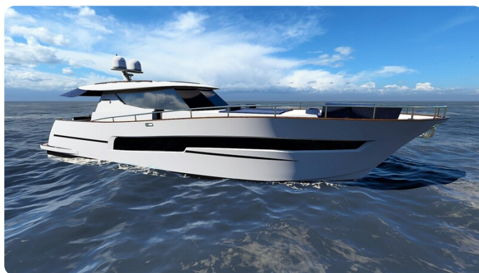
Copy of Front profile