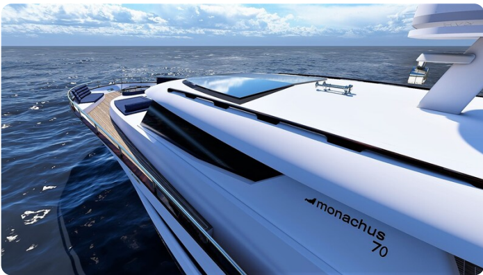
Copy of Top-side view