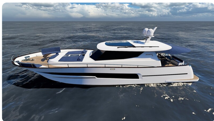
Copy of Side view