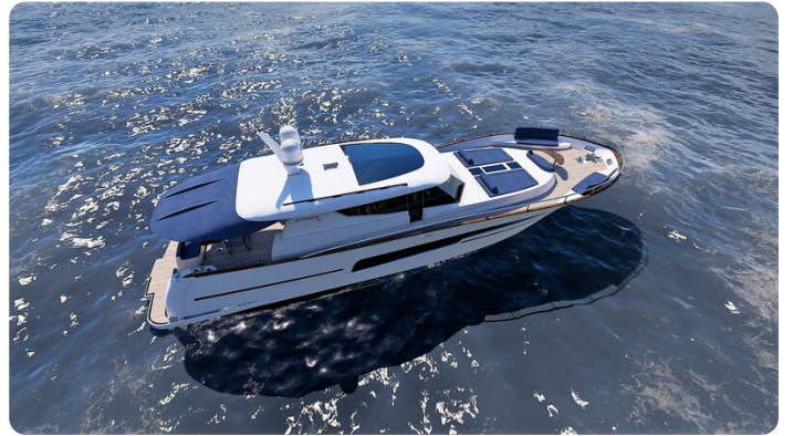
Copy of Top view