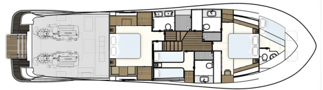
Lower deck 3 cabin