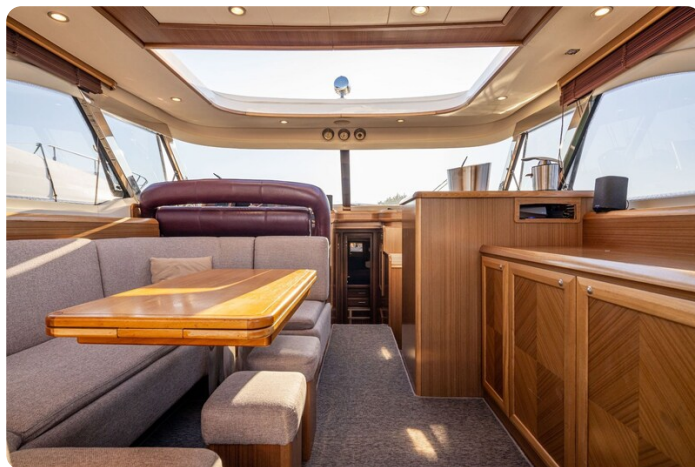
Dolphin 51 salon