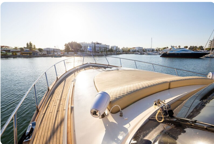
Dolphin 51 bow deck