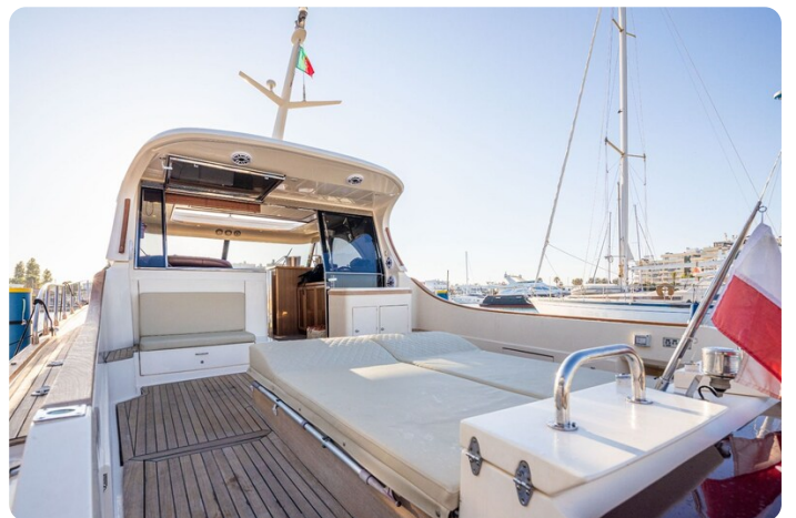
Dolphin 51 cockpit