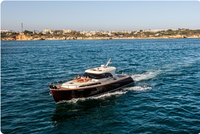
Dolphin 51 cruising