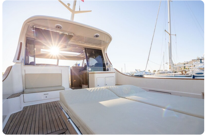
Dolphin 51 cockpit detail