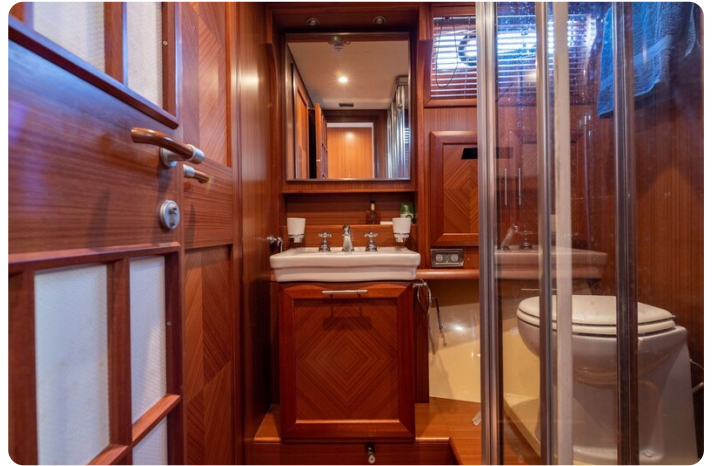
Dolphin 51 bathroom