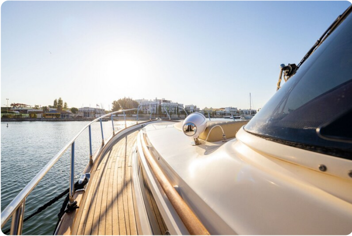
Dolphin 51 sideways