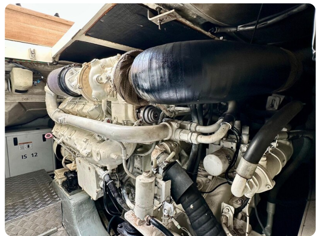
{1} Engine detail