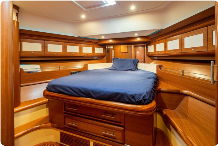
Dolphin 51 Vip cabin