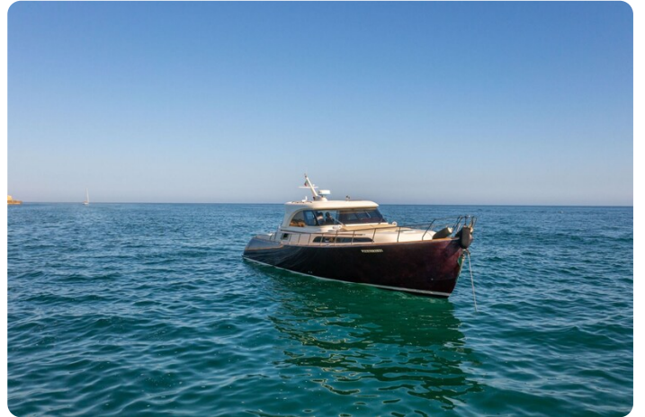
Dolphin 51 bow view