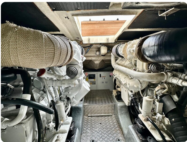
{1} Engine room