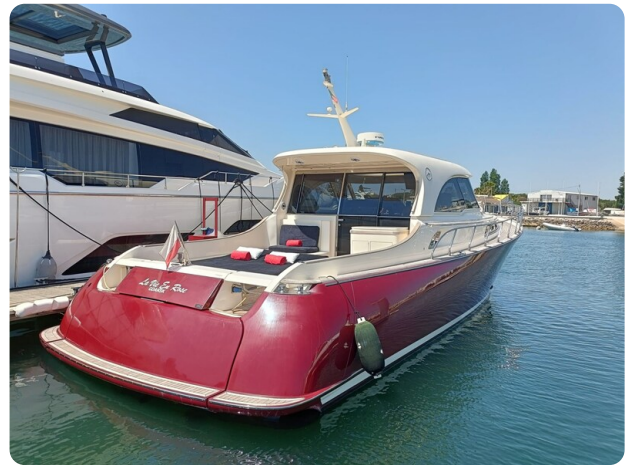
Dolphin 51 aft view