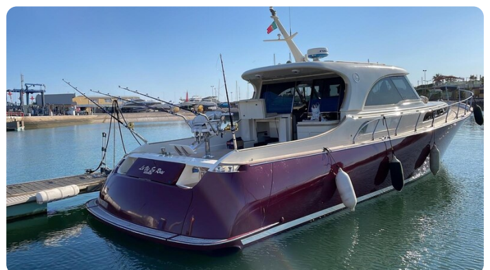
Dolphin 51 aft profile