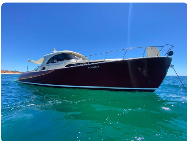
Dolphin 51 bow profile