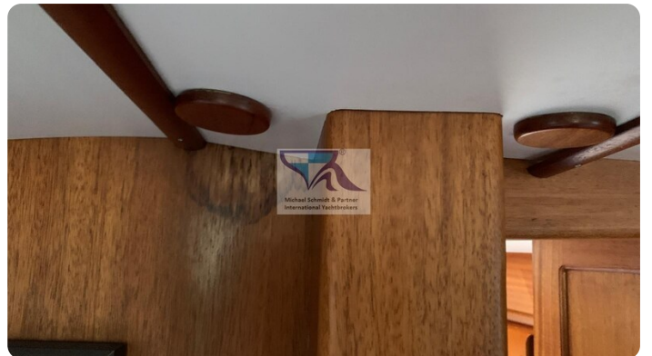
Malö 106 msp808679 21