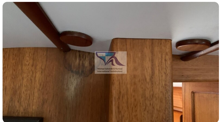
Malö 106 msp808679 21