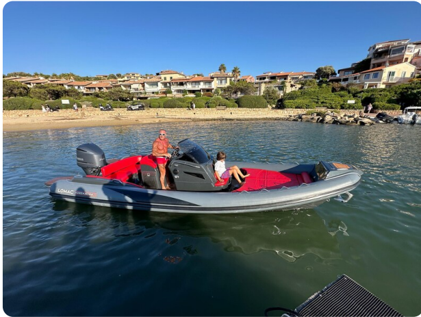
Lomac 7.50 Adrenalina view