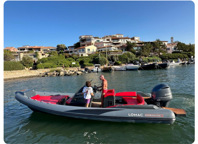
Lomac 7.50 Adrenalina profile 4