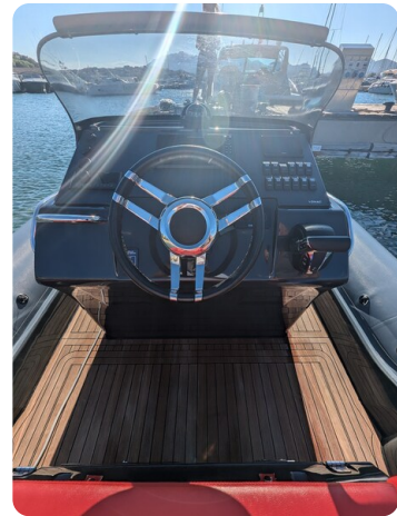
Lomac Adrenalina 7.5