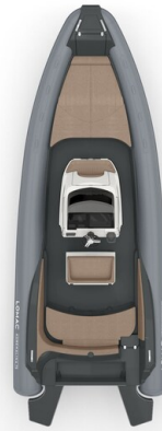
Lomac Adrenalina 7.5 layout