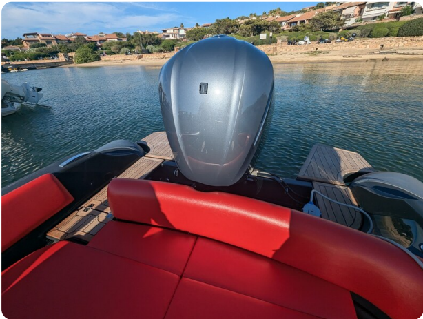
Lomac Adrenalina 7.5 stern view