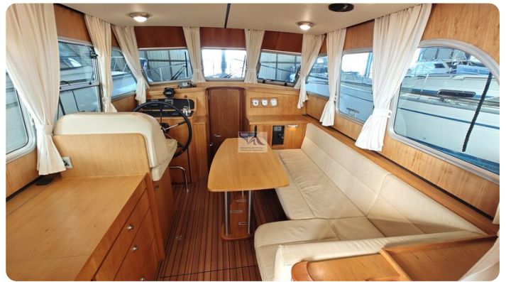
Linssen Grand Sturdy 29.9 19