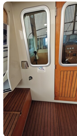
Linssen Grand Sturdy 29.9 56