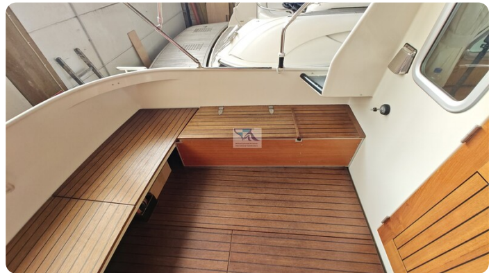
Linssen Grand Sturdy 29.9 53