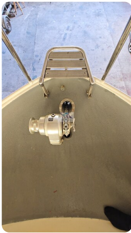
Linssen Grand Sturdy 29.9 33