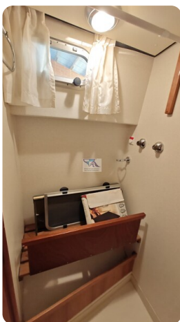
Linssen Grand Sturdy 29.9 51