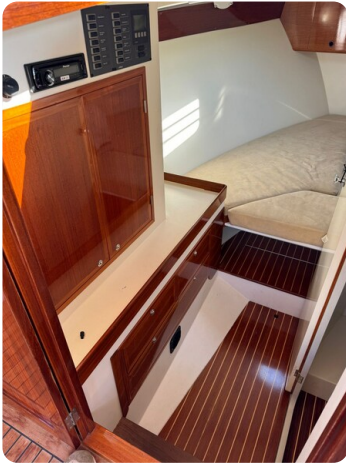
Kiel Legend 28 49