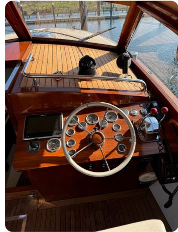
Kiel Legend 28 50