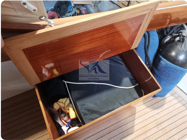
Kiel Legend 28 32