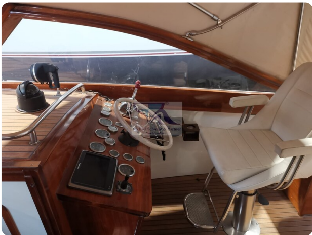
Kiel Legend 28 15