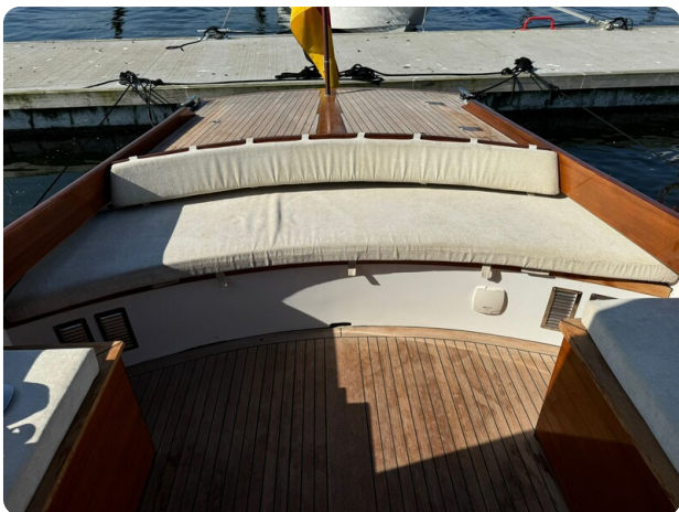
Kiel Legend 28 51