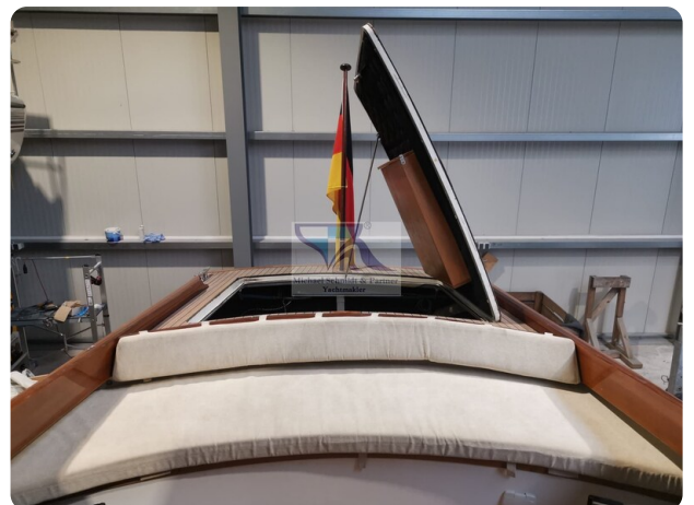
Kiel Legend 28 28