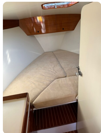
Kiel Legend 28 47