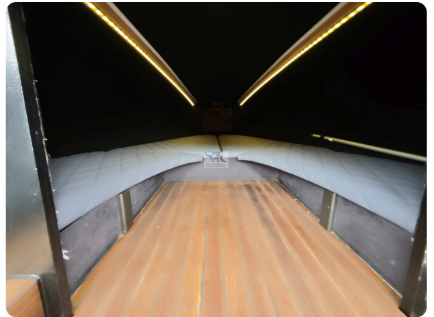
Kaiser 650 Super Sport 3