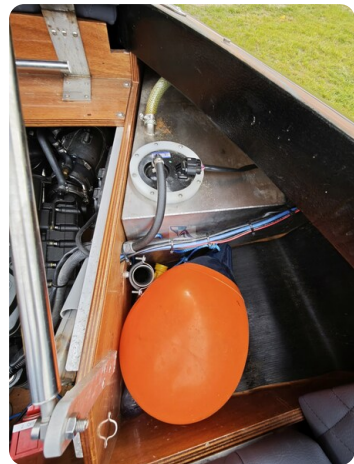
Kaiser 650 Super Sport 12