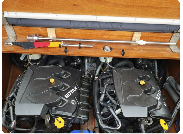
Kaiser 650 Super Sport 23