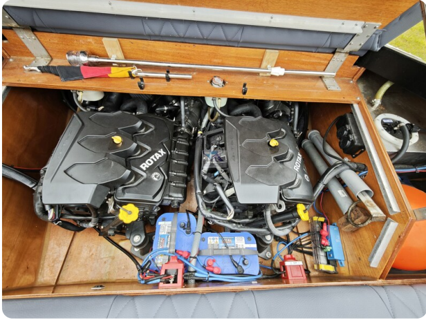
Kaiser 650 Super Sport 8