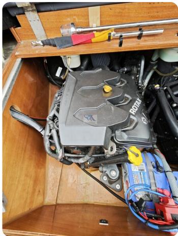
Kaiser 650 Super Sport 10