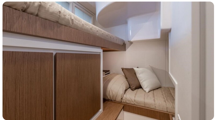
Itama 45RS guest cabin