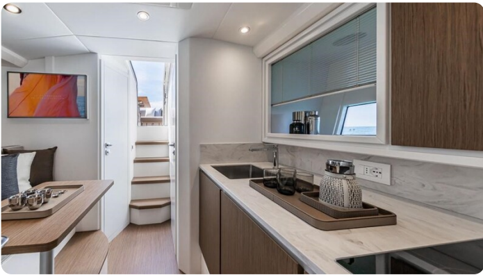
Itama 45RS salon