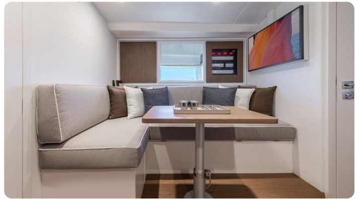
Itama 45RS salon detail