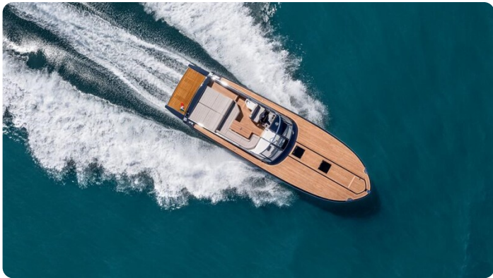
Itama 45RS cruising