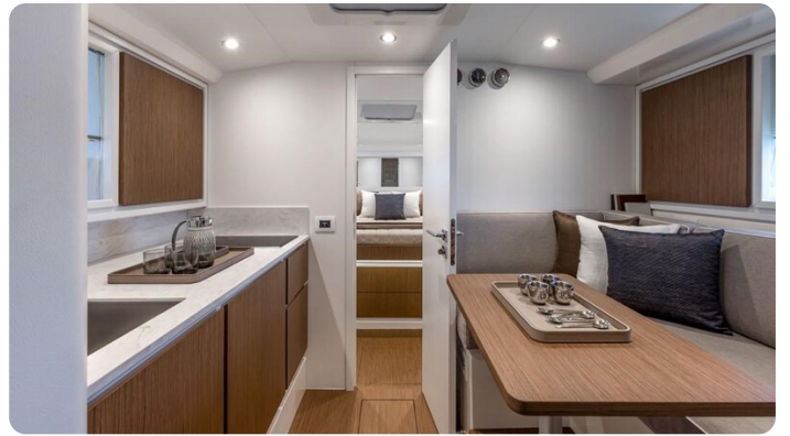
Itama 45RS interiors