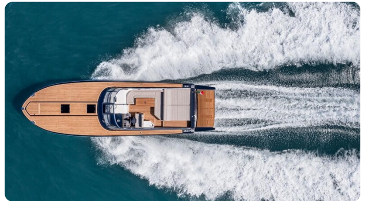
Itama 45RS running