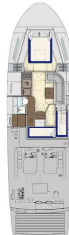
Itama 45RS lower layout