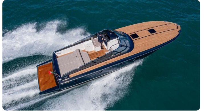
Itama 45RS aerial view