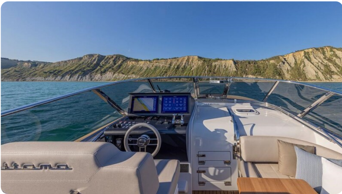
Itama 45RS helm station