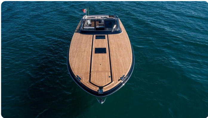
Itama 45RS bow view