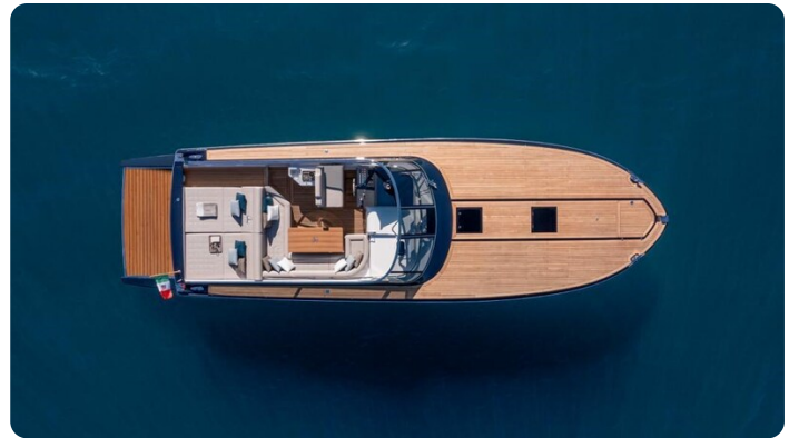
Itama 45RS aerial