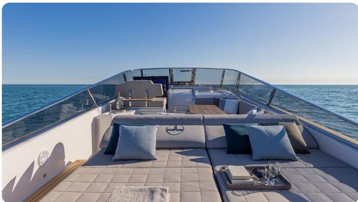
Itama 45RS aft sunpad