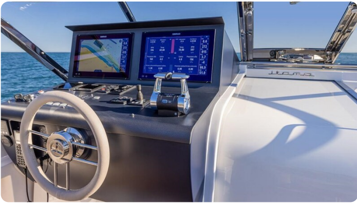
Itama 45RS helm