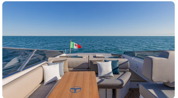
Itama 45RS cockpit dinette