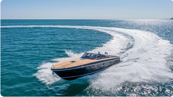
Itama 45RS running profile