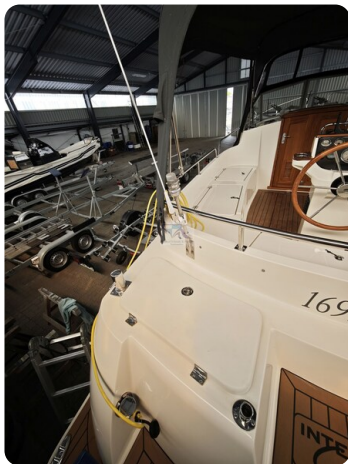
Inter cruiser 28 Cabrio ELVIRA 23