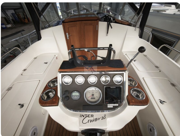
Inter cruiser 28 Cabrio ELVIRA 35