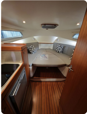
Inter cruiser 28 Cabrio ELVIRA 45