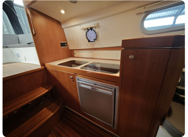
Inter cruiser 28 Cabrio ELVIRA 54