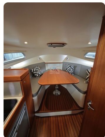
Inter cruiser 28 Cabrio ELVIRA 59