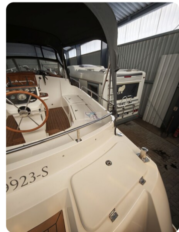
Inter cruiser 28 Cabrio ELVIRA 22