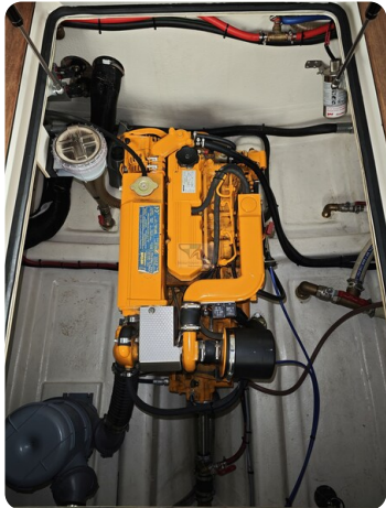
Intercruiser 28 Cabrio ELVIRA 40