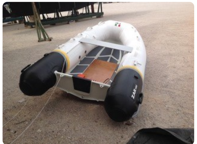
92 Dinghi 2019