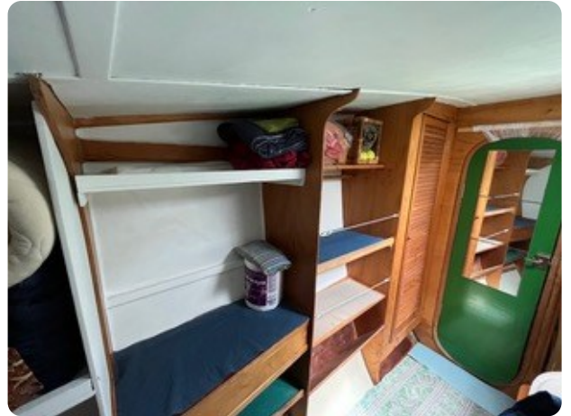
63 Koje Gäste