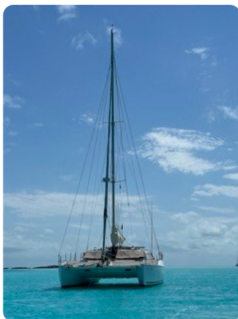
17 von vorne