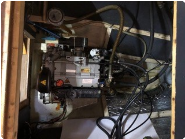
82 Motor von oben