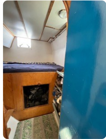
65 Koje Gäste achtern