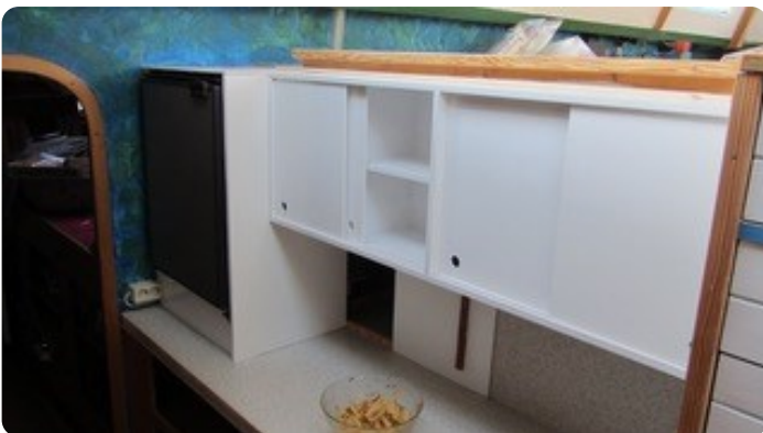
51 Küche BB