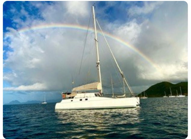
13 von der Seite