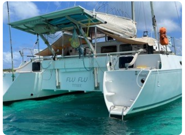
14 von hinten