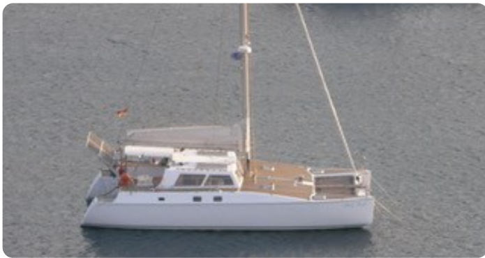
12 von der Seite