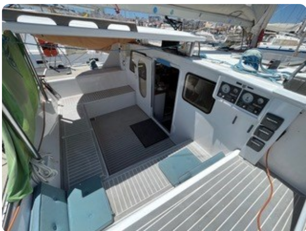
40 Cockpit Übersicht