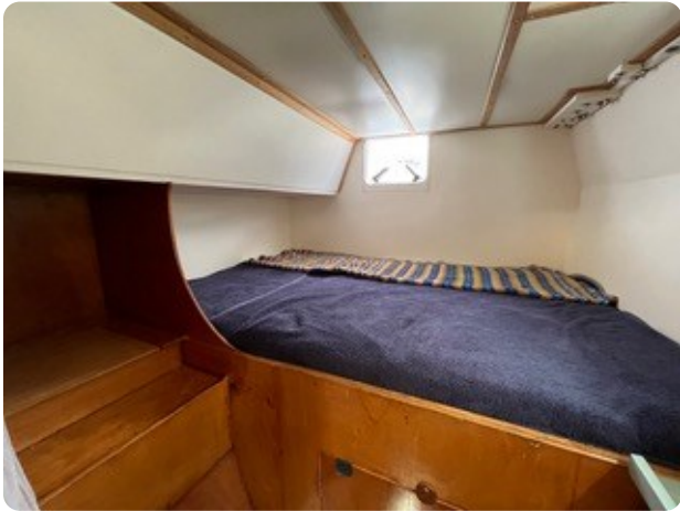
64 KojeGäste achtern