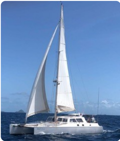
20 Gross und Genua