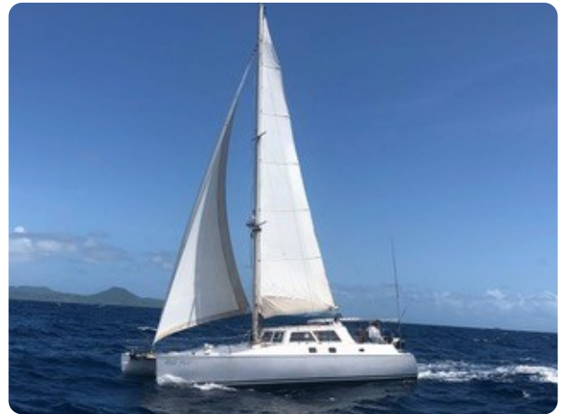
21 Gross und Genua