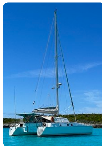
15 von hinten