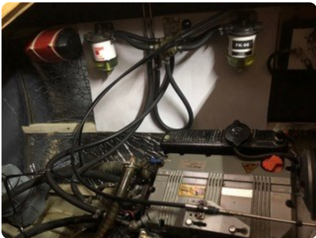
85 Motorraum Dieselfilter