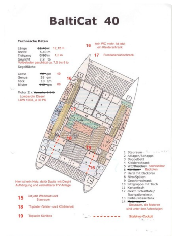
10 Grundriss original mit Änderungen