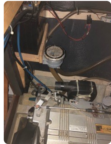
83 Motorraum Seewasserfilter