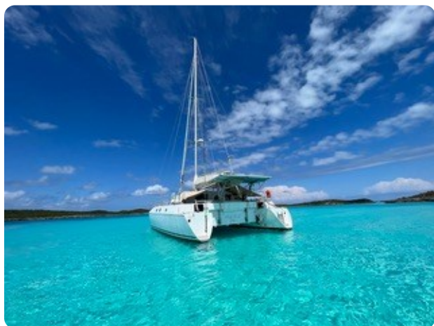
16 von hinten