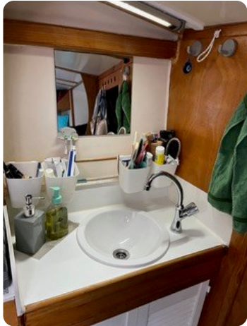
61 Koje Eigner WB