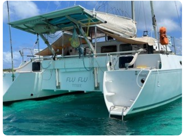
14 von hinten