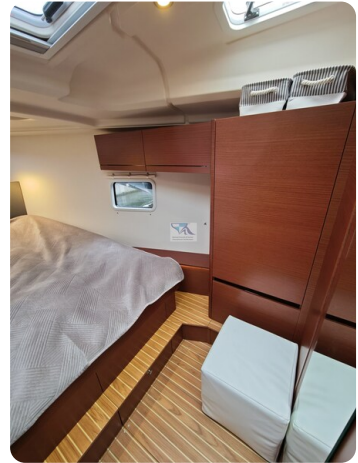
Hanse 418 EDGE 17