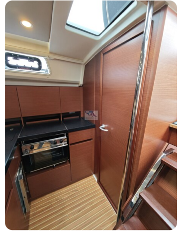
Hanse 418 EDGE 39