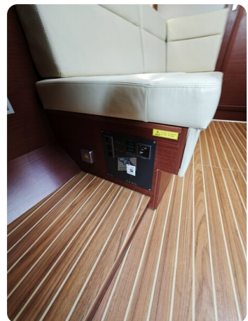
Hanse 418 EDGE 31