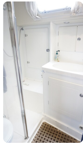
Hallberg Rassy 48 AURORA 34