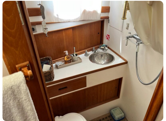
Grand Banks 42 Classic bathroom