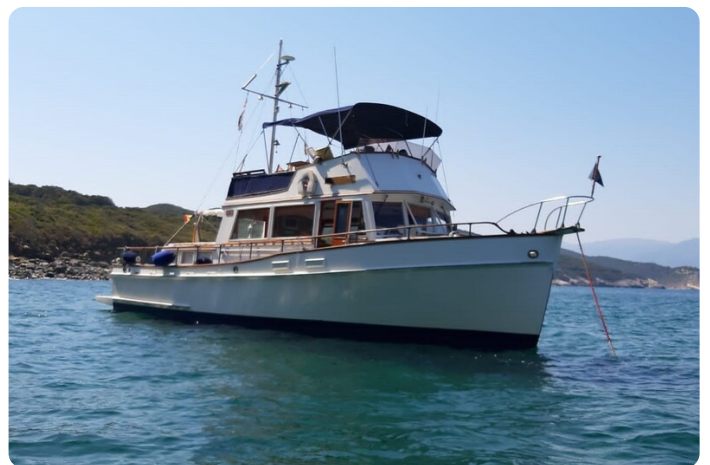
Grand Banks 42 Classic bow view