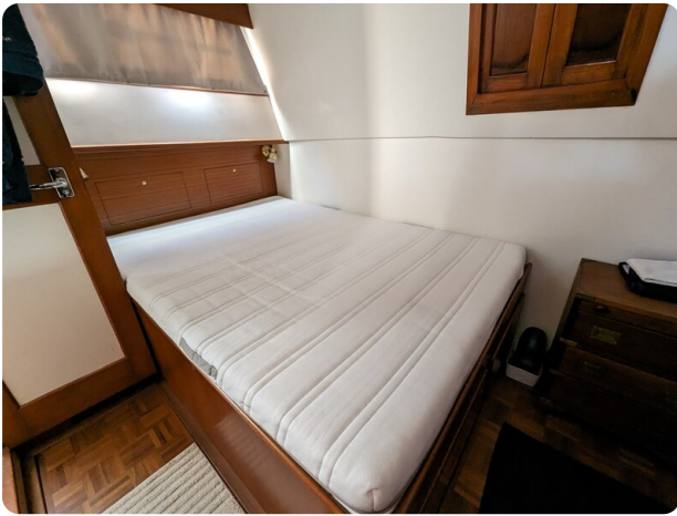
Grand Banks 42 Classic owner's cabin