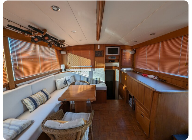
Grand Banks 42 Classic salon2