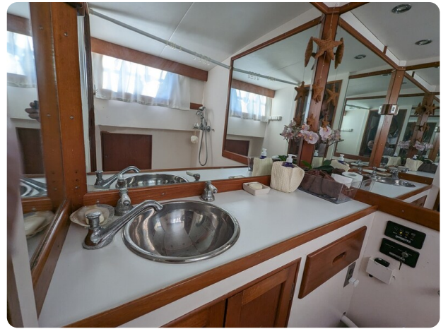
Grand Banks 42 Classic owner's bathroom