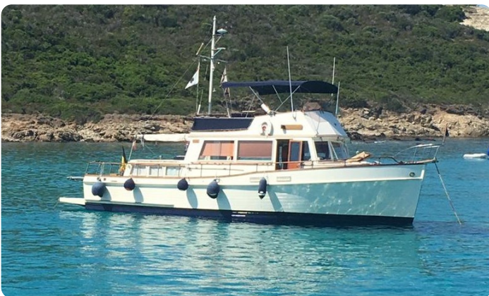
Grand Banks 42 Classic anchored