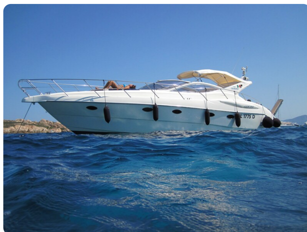
Gobbi 425 esterno (2)