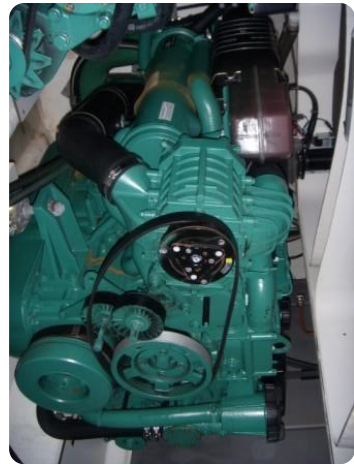
Gobbi 425 motori