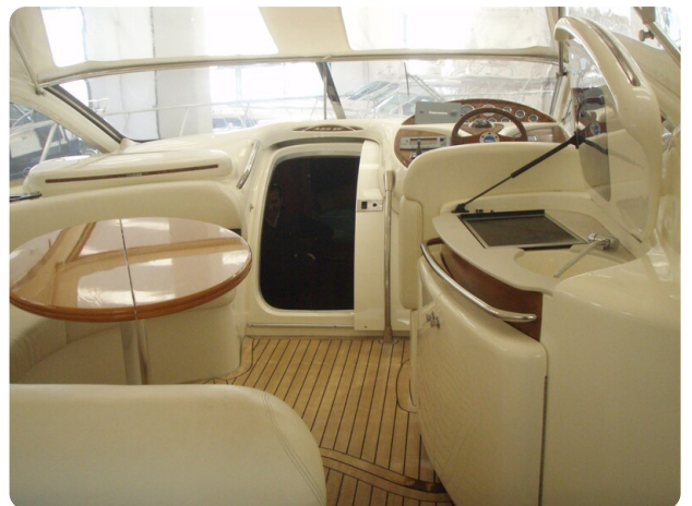
Gobbi 425 interno