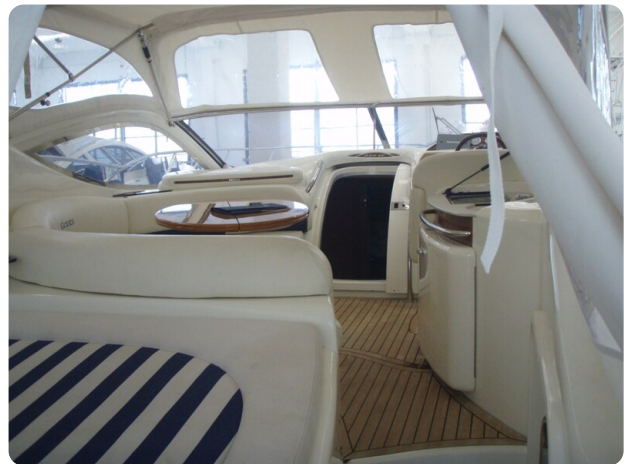
Gobbi 425 esterno