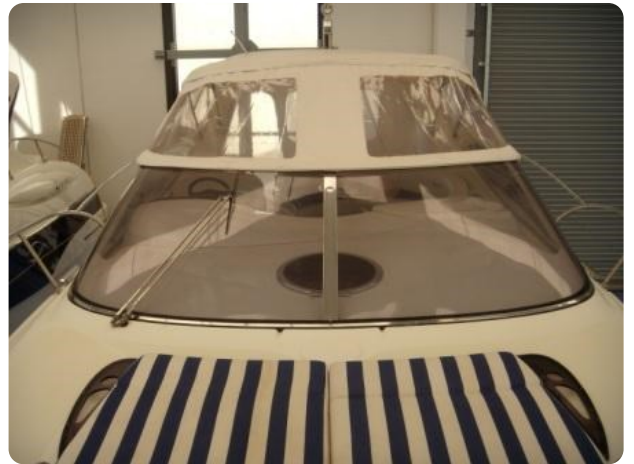
Gobbi 425 esterno (9)