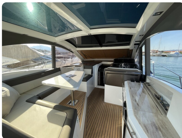
Galeon 485 HTS ext dinette