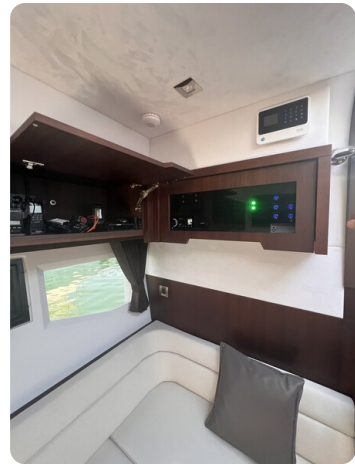
Galeon 485 HTS dinette detail