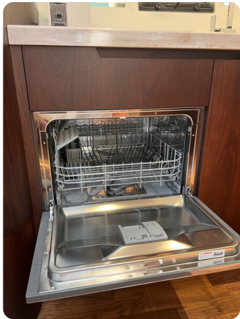
Galeon 485 HTS dishwasher