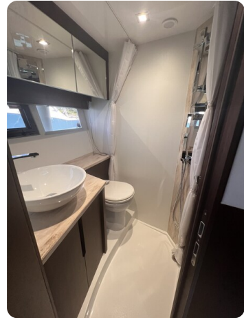
Galeon 485 HTS bathroom