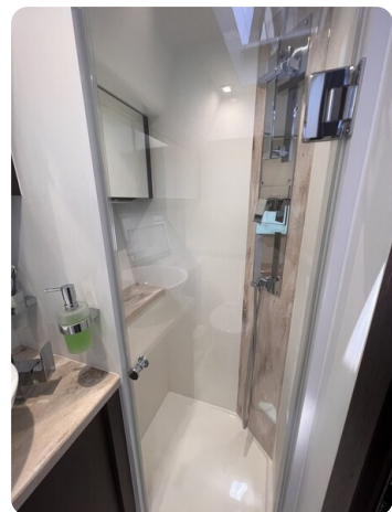
Galeon 485 HTS shower