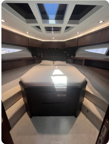
Galeon 485 HTS Vip cabin