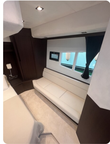
Galeon 485 HTS master cabin detail