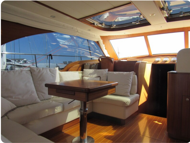
Franchini 55 Emozione, dinette