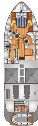
Franchini 55 lower layout