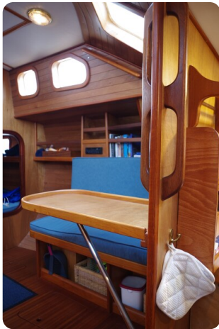
Skorpion II ESTRELLA 48