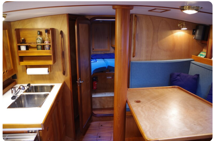
Skorpion II ESTRELLA 34