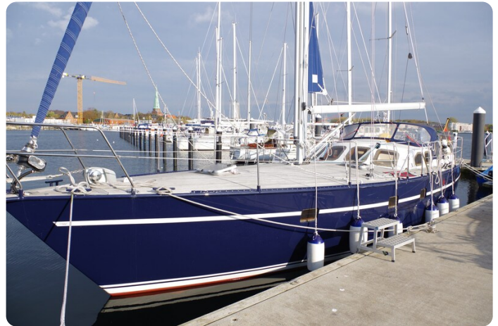
SKORPION II ESTRELLA 15