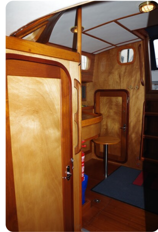
Skorpion II ESTRELLA 39