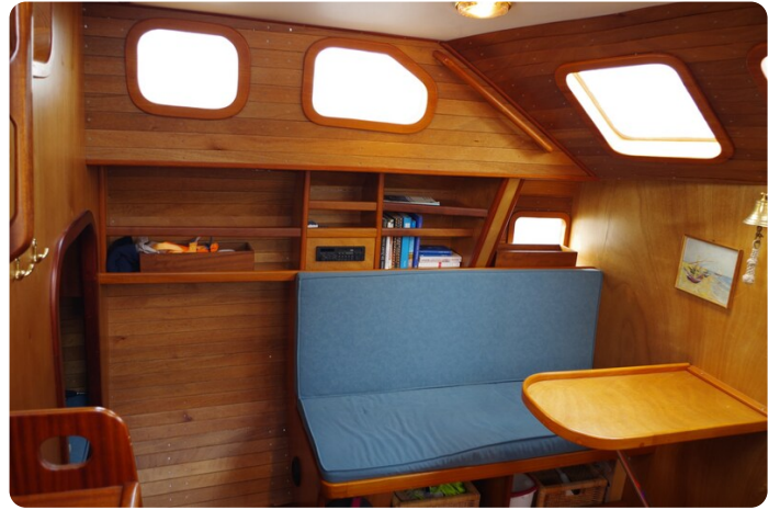
Skorpion II ESTRELLA 31