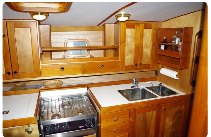
Skorpion II ESTRELLA 45