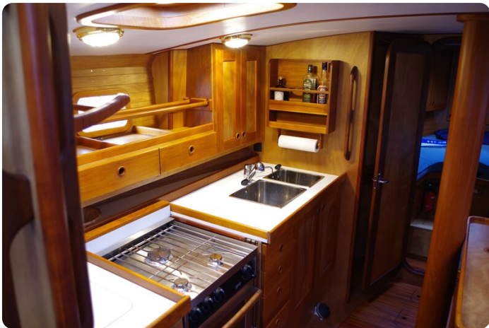
Skorpion II ESTRELLA 33