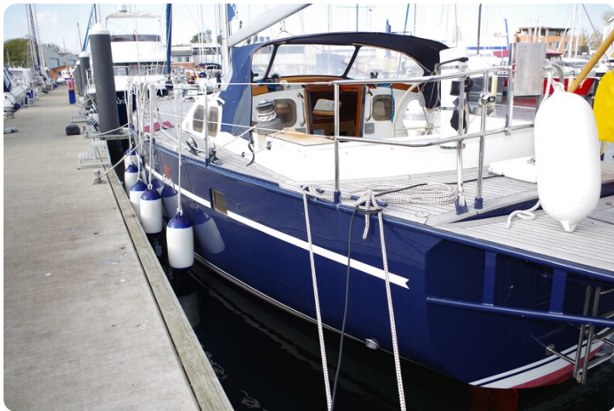
SKORPION II ESTRELLA 6