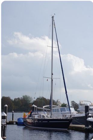
SKORPION II ESTRELLA 21