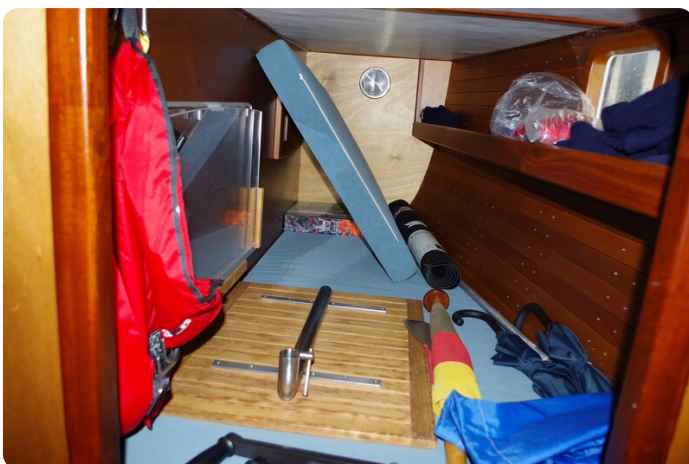
Skorpion II ESTRELLA 54