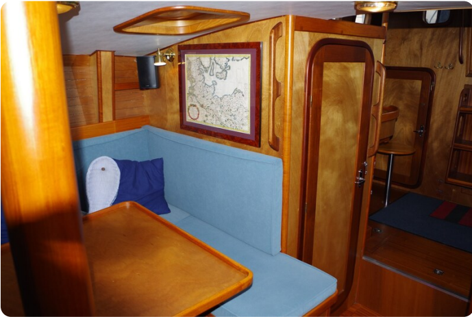
Skorpion II ESTRELLA 37