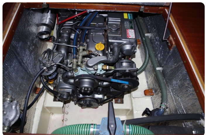
Skorpion II ESTRELLA 56