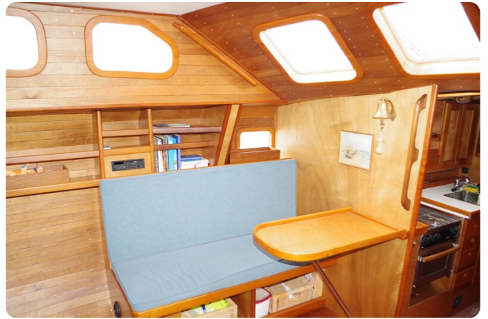
Skorpion II ESTRELLA 26