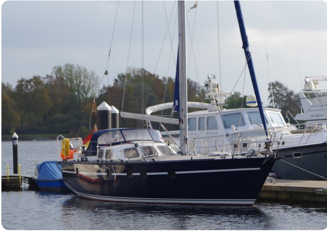
SKORPION II ESTRELLA 20