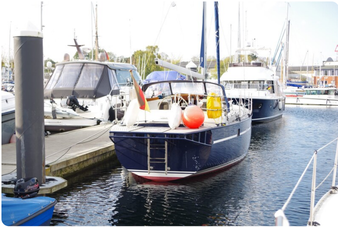
SKORPION II ESTRELLA 1