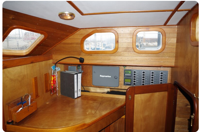
Skorpion II ESTRELLA 62