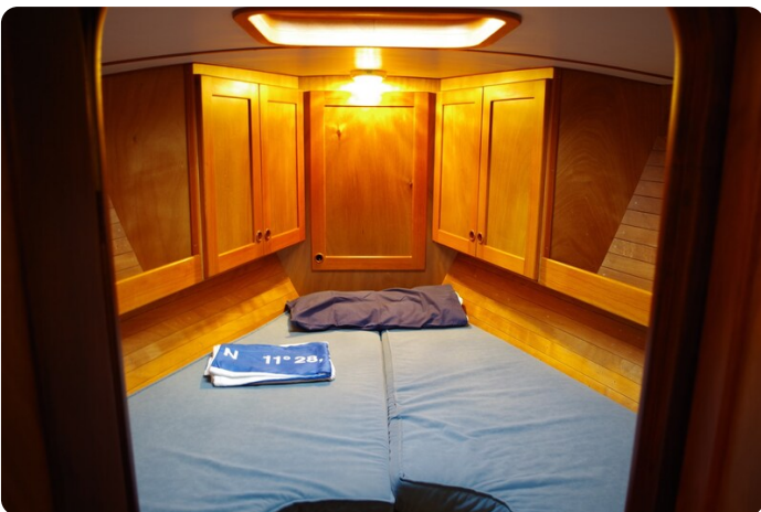
Skorpion II ESTRELLA 42