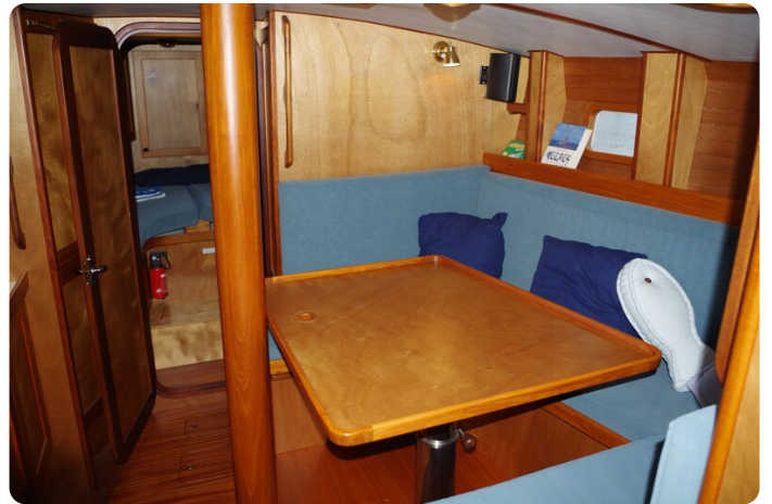
Skorpion II ESTRELLA 36