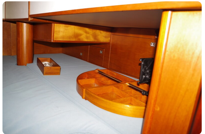
Skorpion II ESTRELLA 53