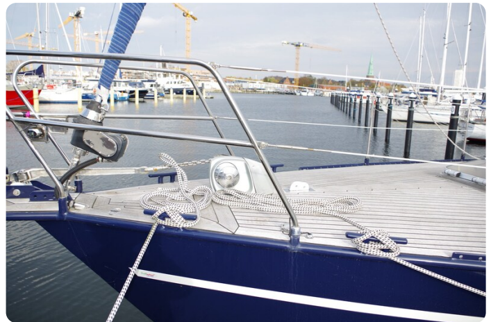
SKORPION II ESTRELLA 9