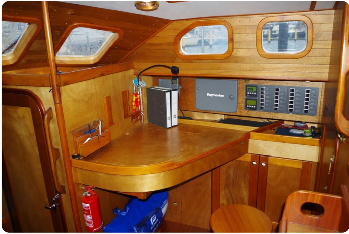
Skorpion II ESTRELLA 27