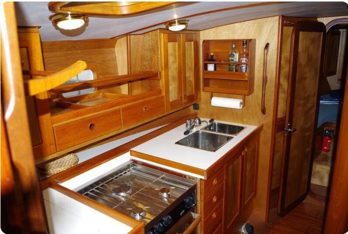
Skorpion II ESTRELLA 35