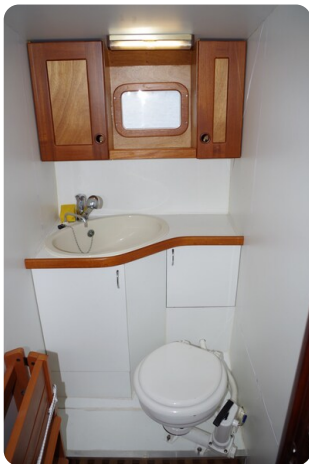
Skorpion II ESTRELLA 50