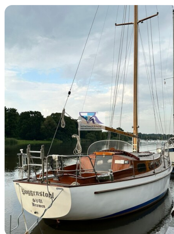
Skorpion I 1