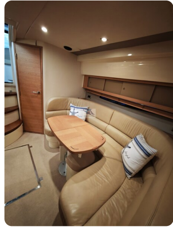
Fairline Targa 38 29