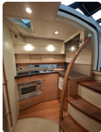
Fairline Targa 38 32