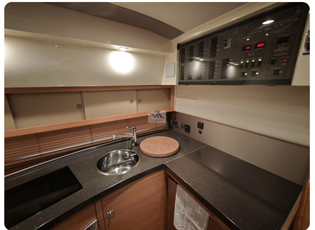
Fairline Targa 38 9