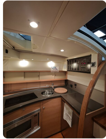
Fairline Targa 38 7