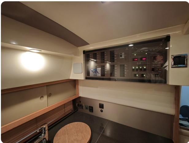
Fairline Targa 38 8