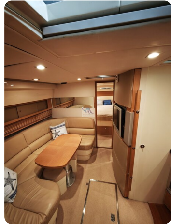
Fairline Targa 38 5