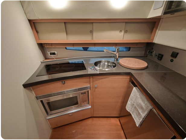
Fairline Targa 38 14