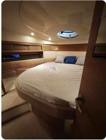
Fairline Targa 38 50