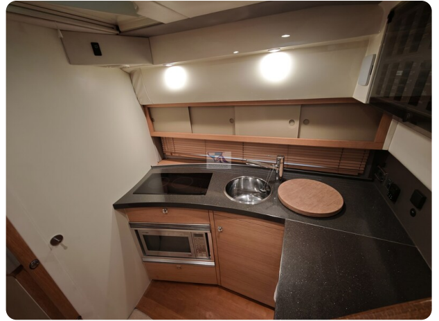
Fairline Targa 38 3