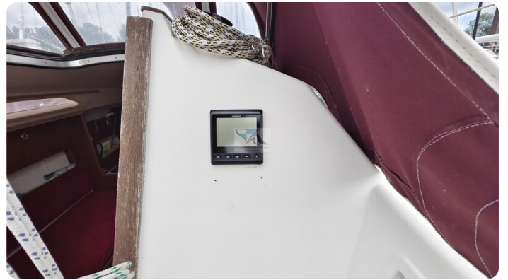
Etap 23i 28