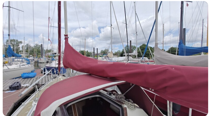
Etap 23i 29