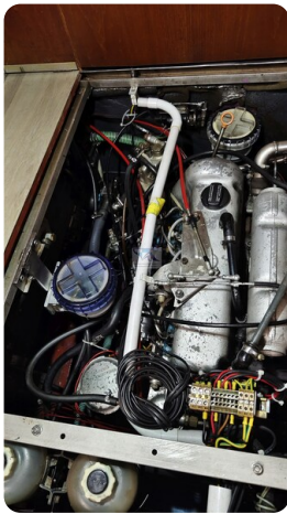
Reinke Tourina 10m_51