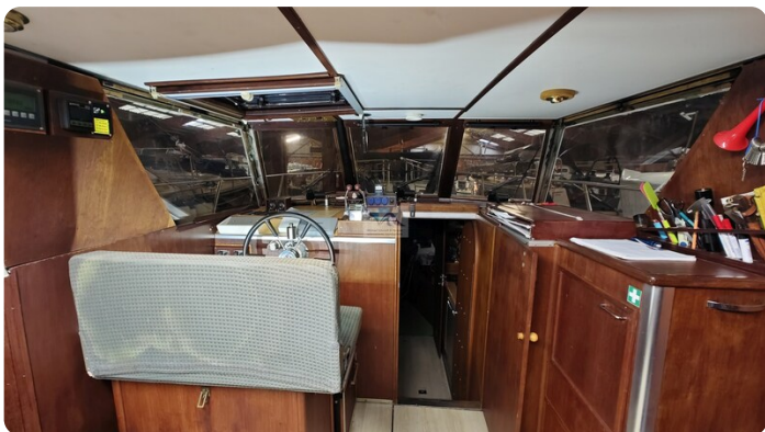
Reinke Tourina 10m_35