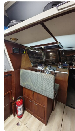
Reinke Tourina 10m_37