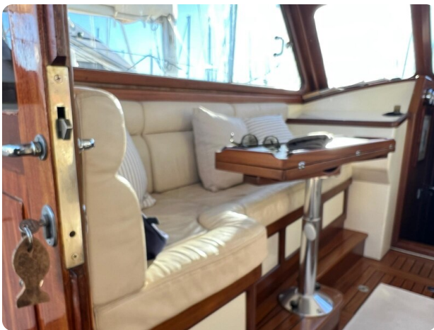
Liberty 35 dinette