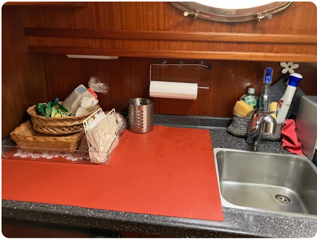
Liberty 35 galley