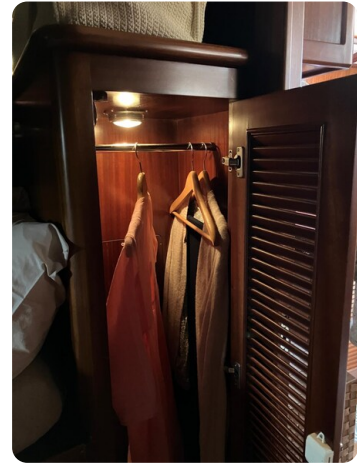
Liberty 35 interiors