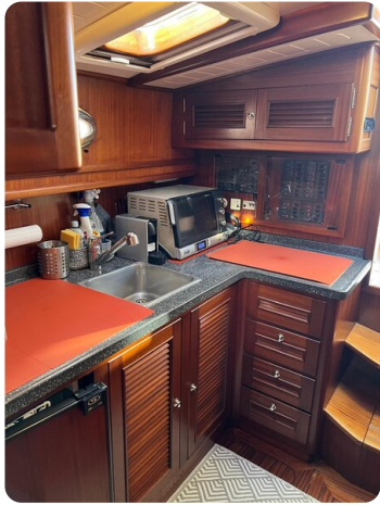
Liberty 35 galley overview