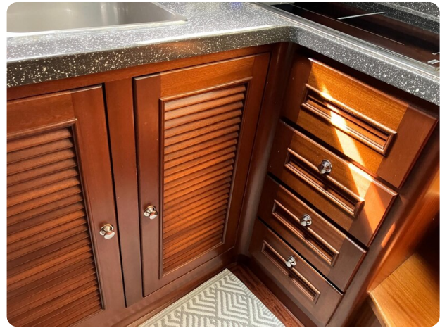
Liberty 35 galley detail