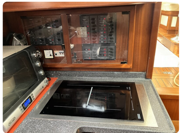
Liberty 35 Cockpit Galley Detail