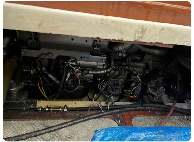
Liberty 35 engine room