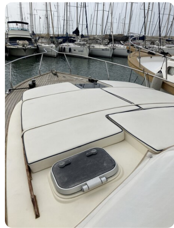
Liberty 35 Bow Sunpad