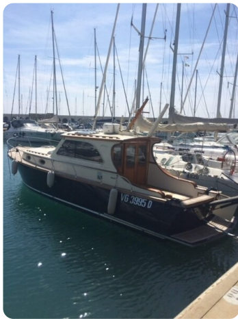
Liberty 35 Aft Profile Detail