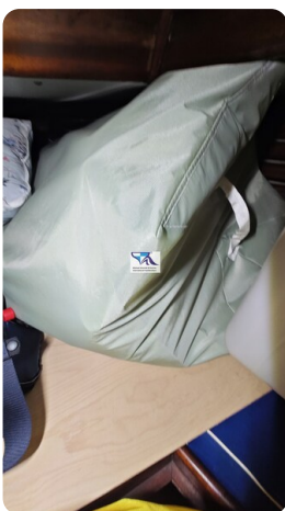
Marken II_msp797539 111