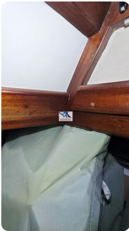
Marken II_msp797539 115