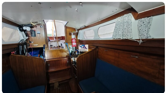
Marken II_msp797539 89