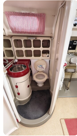
Dehler 36 mr_msp788732_32