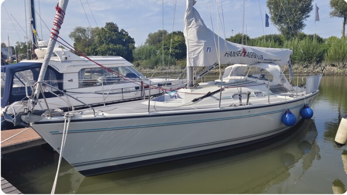
Dehler 36 mr_msp788732_4