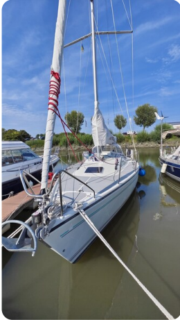
Dehler 36 mr_msp788732_5