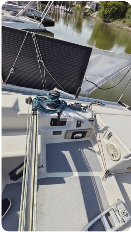
Dehler 36 mr_msp788732_18