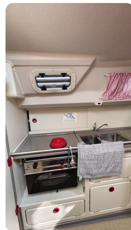
Dehler 36 mr_msp788732_29