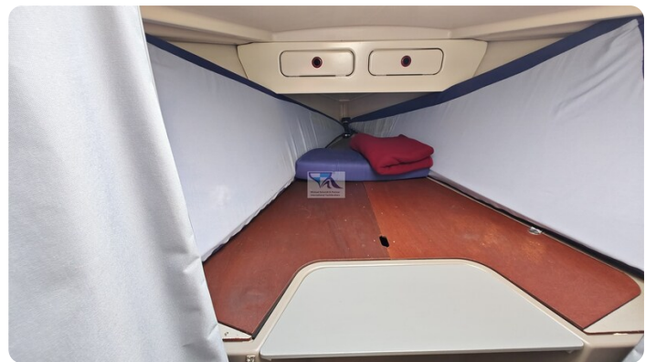
Dehler 36 mr_msp788732_39