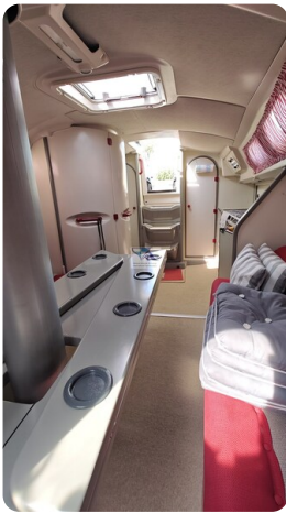
Dehler 36 mr_msp788732_42