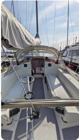
Dehler 36 mr_msp788732_20