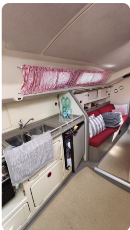
Dehler 36 mr_msp788732_28