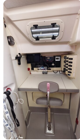
Dehler 36 mr_msp788732_34