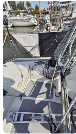
Dehler 36 mr_msp788732_19