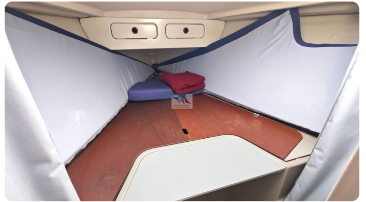
Dehler 36 mr_msp788732_41