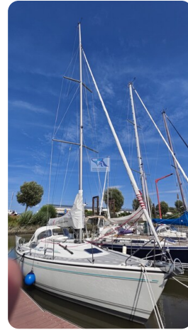
Dehler 36 mr_msp788732_2