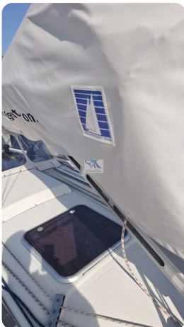
Dehler 36 mr_msp788732_15