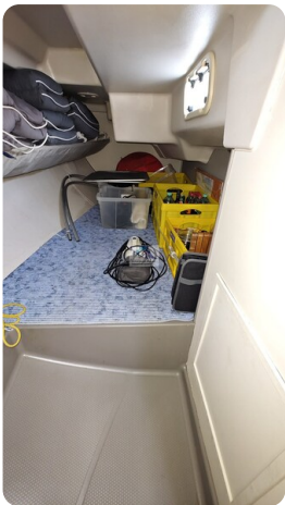
Dehler 36 mr_msp788732_35