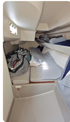
Dehler 36 mr_msp788732_36