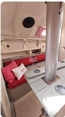
Dehler 36 mr_msp788732_44