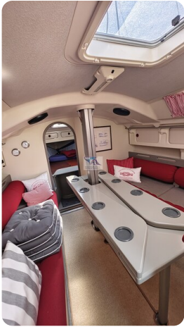
Dehler 36 mr_msp788732_30