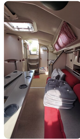
Dehler 36 mr_msp788732_43