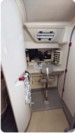
Dehler 36 mr_msp788732_33