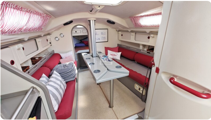
Dehler 36 mr_msp788732_38