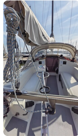
Dehler 36 mr_msp788732_24