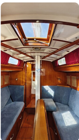
6 KR De Dood 22