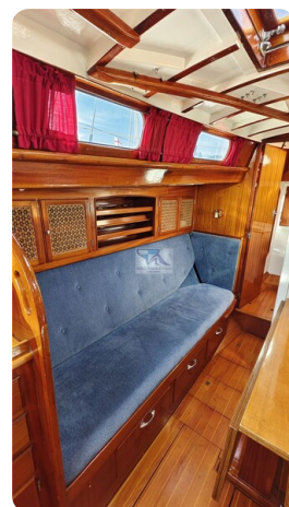
6 KR De Dood 21