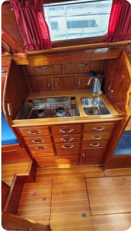
6 KR De Dood 19