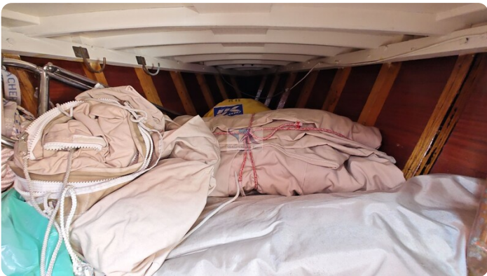
6 KR De Dood 27