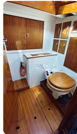
6 KR De Dood 23