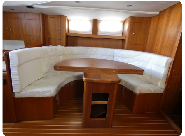
Van de Stadt 51 msp548133 14