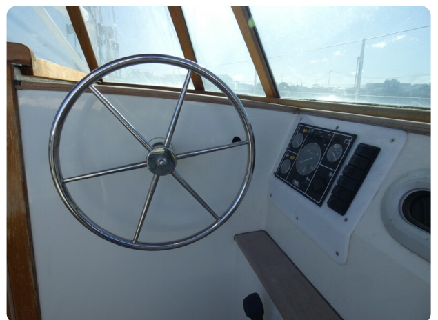
Van de Stadt 51 msp548133 12