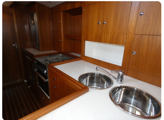
Van de Stadt 51 msp548133 16