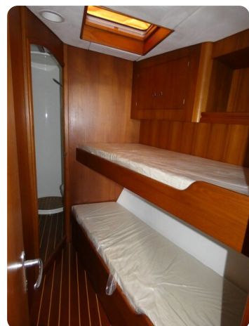
Van de Stadt 51 msp548133 18