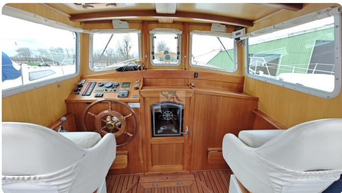
Spitzgatt Kutter LADY 28