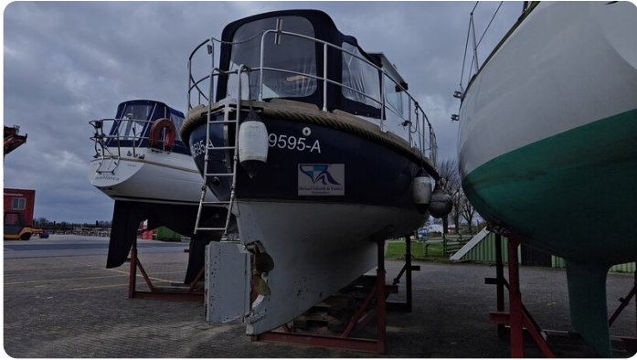
Spitzgatt Kutter LADY 1