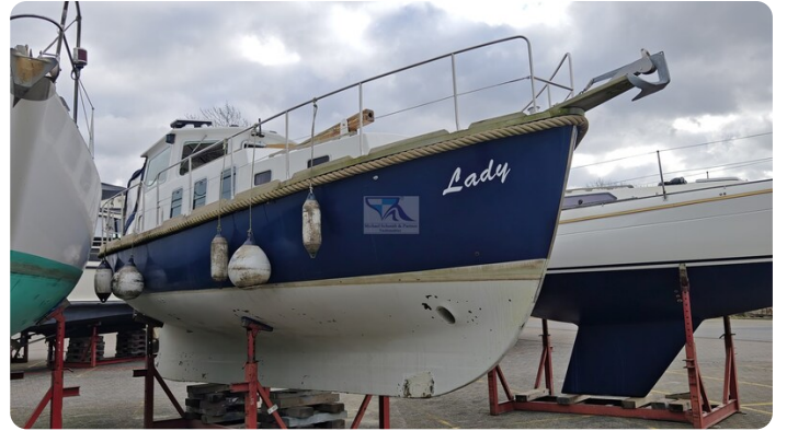
Spitzgatt Kutter LADY 7